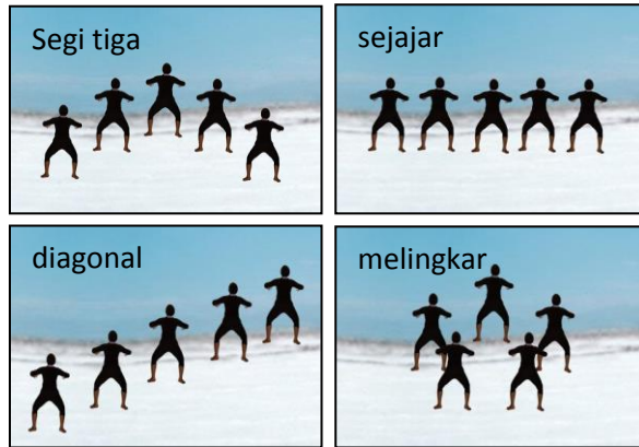
Pola Lantai, (Beben, 2013)

5). Gunakan arah hadap yang mengatur sikap dan pergerakan kemana arah hadap dari seorang penari dalam membawakan tarian