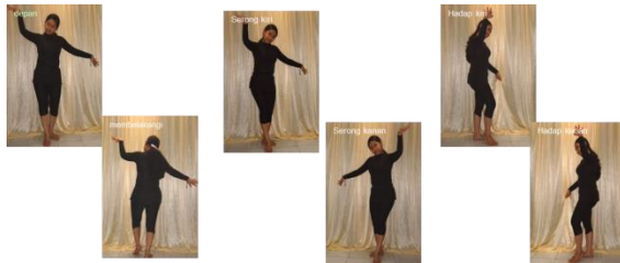
Arah hadap, (deden, 2013)

5). Gunakan arah hadap yang mengatur sikap dan pergerakan kemana arah hadap dari seorang penari dalam membawakan tarian