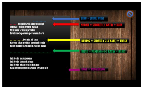
Gambar 2 Demo Pengoperasian “Media Puisi Digital”

Pembelajaran didesain agar berpusat kepada siswa, interaksi belajar sepenuhnya terjadi antara siswa, media, dan kelompoknya.