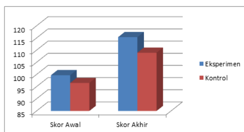
Gambar 2. Diagram Perbedaan Peningkatan Skor Awal dan Skor Akhir Disposisi Matematis di Kelas Eksperimen dan Kontrol

Untuk lebih jelasnya, berikut adalah diagram yang menggambarkan perbedaan peningkatan disposisi matematis di kelas eksperimen dan kelas kontrol. Melalui diagram tersebut dapat diketahui bahwa rata-rata skor disposisi matematis di kelas eksperimen lebih tinggi dibandingkan kelas kontrol.