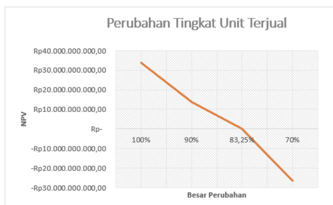
Gambar 3. Diagram Perubahan Tingkat Unit Terjual