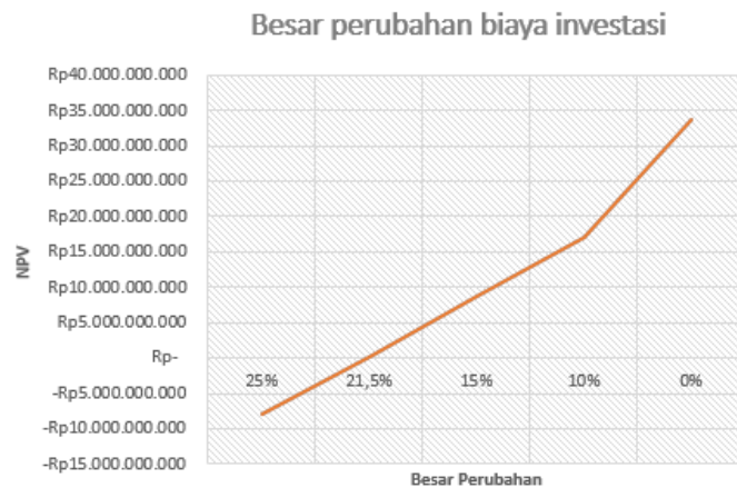
Gambar 2. Diagram Besar Perubahan Biaya Investasi