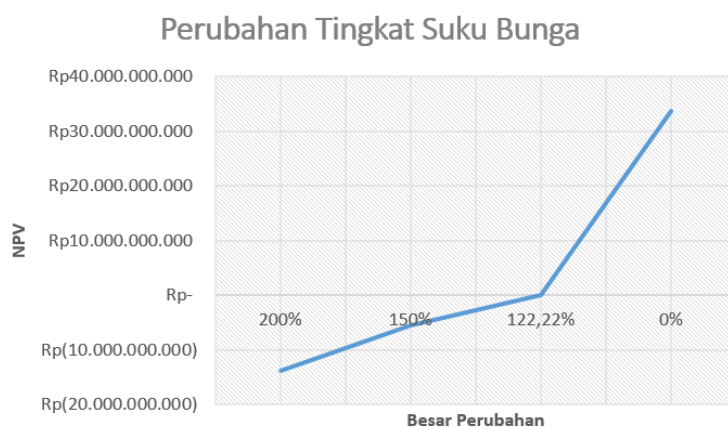
Gambar 5. Diagram Perubahan Tingkat Suku Bunga