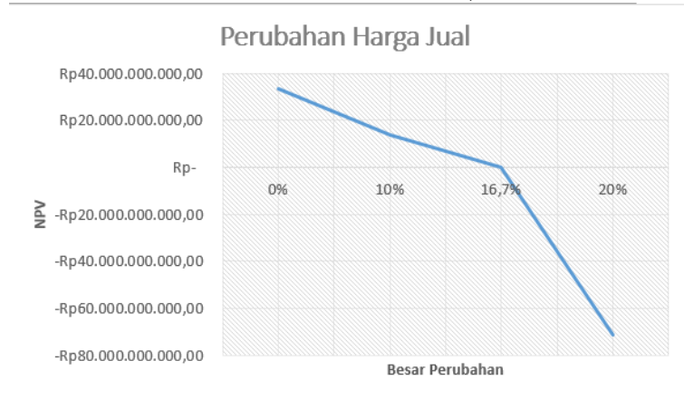
Gambar 4. Diagram Perubahan Harga Jual