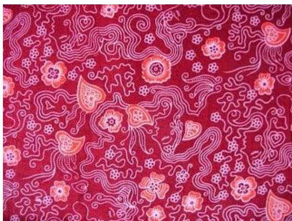
Gambar 4. Motif Nyi Rambut Kasih

Nyi Rambut Kasih dipercaya oleh warga lokal sebagai ratu Kerajaan Sindang Kasih yang menjadi cikal bakal berdirinya Kabupaten Majalengka. Adapun motif Nyi Rambut Kasih dapat dilihat di bawah ini.