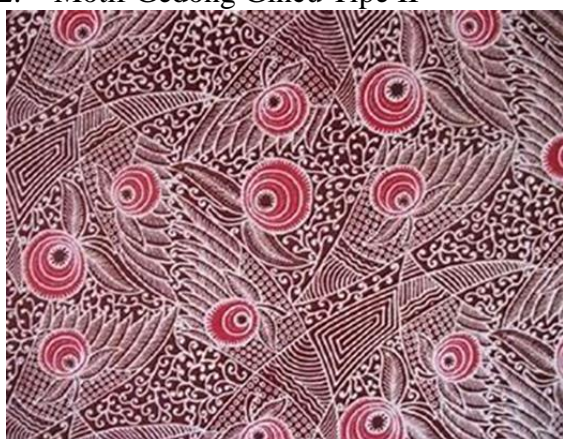
Gambar 2. Motif Gedong Gincu Tipe II

Digunakan sebagai corak batik seragam sekolah dasar di Majalengka. Terdapat dua buah mangga gedong gincu yang dilengkapi dengan daun dua buah dalam satu tangkai yang melambangkan keselarasan hidup. Terdapat bunga mekar yang merefleksikan kemakmuran warga Majalengka.