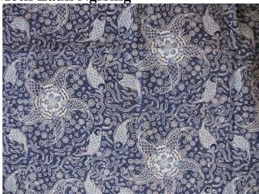
Gambar 6. Motif Lauk Ngibing

Selaras dengan potensi alam yang ada di Kabupaten Majalengka. Batik ini ditandai dengan gambar ikan berjumlah lima ekor yang sedang menari mengelilingi sebuah bunga yang tengah mekar. Hal ini melambangkan konsekuensi dan tanggung jawab yang ditanggung oleh warga Majalengka diselaraskan dengan rasa syukur ke hadirat Tuhan Yang Maha Esa atas segala karunia yang telah diberikan. Adapun ikan melambangkan kemandirian dan keberanian menghadapi hidup.