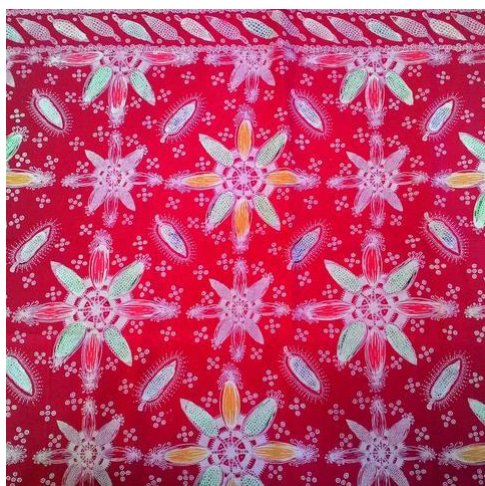
Gambar 7. Motif Jagung

Filosofi motif jagung menggambarkan mimpi dan semangat hidup yang tidak pernah padam.