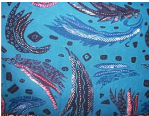
Gambar 5. Motif Angin

Ditandai dengan delapan penjuru mata angin yang melambangkan kekuatan, keperkasaan, kewibawaan, keteguhan, ketegaran, ketangguhan, kesigapan, dan keberanian masyarakat Majalengka. Hal ini sejalan dengan keadaan alam Majalengka.