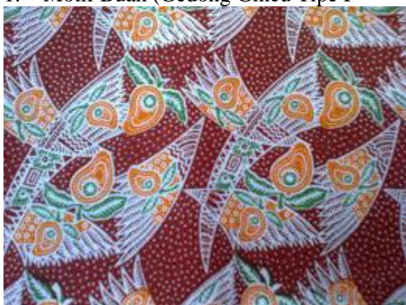
Gambar 1. Motif Gedong Gincu Tipe I

Dipakai secara luas, tidak hanya oleh para pegawai negeri. Terdapat gedong gincu bergaris dengan lingkaran berjumlah tiga buah. Di bagian terdalam terdapat inti berbentuk bunga matahari. Memiliki dua daun seolah membentuk sayap, akar, dan garis kotak. Melambangkan sinergi positif yang terjalin antarwarga dan antara warga dengan pemerintah daerah demi terciptanya lingkungan kondusif yang religius, maju, dan sejahtera, serta tercapainya cita-cita bersama.