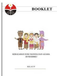
Gambar 1. Cover Produk Akhir

Hasil Tabel 4.2 menunjukkan bahwa produk booklet tema 7 subtema 1 keragaman suku bangsa dan agama di negeriku layak digunakan dalam kegiatan pembelajaran. Produk adalah hasil akhir dari sebuah proses produksi. Menurut William J. Stanton merupakan politikus Amerika Serikat yang juga seorang pebisnis. Menurutnya, produk merupakan seperangkat atribut yang memiliki wujud atau tidak, termasuk kemasan, harga, warna dan layanan yang bisa diterima oleh pembeli sebagai bentuk pemenuhan terhadap keinginan dan kebutuhan. Berdasarkan arti umumnya produk yakni semua hal yang bisa memenuhi kebutuhan manusia. Bisa berbentuk fisik, bisa juga berbentuk non fisik seperti jasa. Berikut adalah Hasil akhir dari produk media booklet setelah divalidasi oleh ahli pakar.