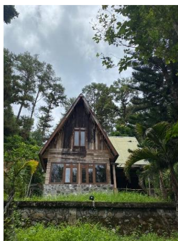
Gambar 3 5 Tampak Depan Rumah Tua

Rumah antik peninggalan zaman jajahan dulu dikenal dengan sebutan rumah scooby-doo. Sebutan ini didapatkan karena bentuknya yang hampir mirip dengan rumah base camp yang ada dalam film kartun berjudul "Scooby-Doo". Dikatakan pada zaman dahulu, rumah tersebut ditempati oleh seorang kapten bernama Dirck dengan istrinya yang sedang mengandung. (Dafrina dkk., 2021), menegaskan bahwa "Rumah dengan gaya Kolonial ini menjadi simbol untuk menentukan kelas atau status sosial seseorang". Sebagai seorang kapten, Dirck mendapat tugas untuk menumpas para pejuang aceh yang memaksakan untuk meninggalkan istrinya. Singkat cerita, Dirck dinyatakan tewas dan menyebabkan istrinya stres hingga meninggal bersama bayi dalam kandungan. Hingga sekarang rumah yang berlokasi dalam Taman Hutan Raya Pocut Meurah Intan, masih dalam bentuk yang sama walaupun ada perbaikan pada bagian-bagian yang rusak dan ada sedikit tambahan pada bagian belakang rumah. Perbaikan yang telah dilakukan sekitar 2 kali, dengan mengganti atap yang bocor, dinding yang telah bolong, dan pada bagian teras.