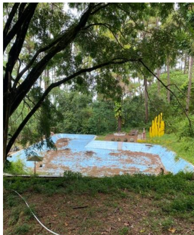
Gambar 3 7 Kolam Sumber observasi lapangan, 2022

Sebelah timur tatura, terdapat satu kolam renang yang dibangun oleh kolonial untuk mereka membersihkan diri dan melakukan aktifitas renang. Kolam yang berukuran cukup besar ini masih dalam kondisi layak untuk digunakan. Bahkan, oleh pihak pengelola taman mengfungsikan kolam sebagai area pemandian (renang) bagi wisatawan.