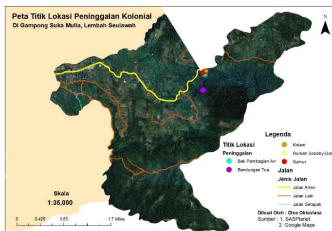
Gambar 3 4 Peta lokasi peninggalan kolonial di Gampong Suka Mulia