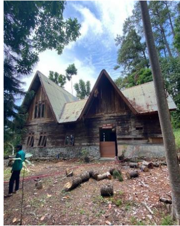
Gambar 3 6 Tampak Samping Rumah Tua

menunjang kegiatan wisata pendidikan. Dalam ruangan tersedia lemari yang berisikan buku mengenai kehutanan, lingkungan, perkebunan, dan lain-lainnya.