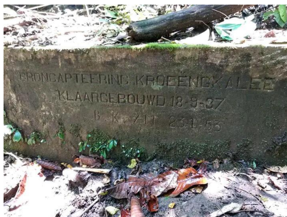
Gambar 3 8 Bendungan Tua Sumber observasi lapangan, 2022

dari rumah rumah tua. Untuk menuju ke lokasi dibutuhkan waktu kurang lebih 1,30 jam dengan track yang cukup sulit. Hasil yang didapatkan peneliti, penyimpanan air tersebut masih berfungsi untuk mengalirkan air ke bak saluran berikutnya.