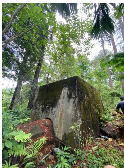
Gambar 3 9 Bak Penyimpanan/pembagian

Bak saluran ini berada dalam area yang berjarak sekitar 17meter dari rumah tua. Bak ini dibuat untuk menyimpan dan menyalurkan air ke sekitar rumah dan kolam yang ada. Bak yang dibuat pada zaman Belanda ini masih dijadikan tempat penyimpanan yang saat ini masih dimanfaatkan seperti dulu serta dilakukan perawatan oleh petugas.