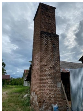
Gambar 3 3 Tampak depan cerobong api

Bangunannya yang masih berdiri kokoh hingga sampai ini tentunya menjadi sebuah pertanyaan bagi sebagian orang-orang (Susanti et al., 2020). Bagaimana bisa bangunan tua tersebut masih bisa berdiri tanpa ada kerusakan pada badan bangunan. Hebatnya orang belanda ialah mereka sebelum membangun sebuah bangunan, pekerja belanda melakukan perancangan dan perhitungan yang matang serta memilih bahan bangunan yang bagus (Raka Gunawarman & Putri, 2019). Untuk itu, bahan yang digunakan adalah semen merah yang dicampur gamping yang menjadi satu. Batu bata merah digiling halus menjadi serbuk lalu dicampur dengan batu kapur sebagai bahan perekat bangunan (Wijaya & Syahrizal, 2019).