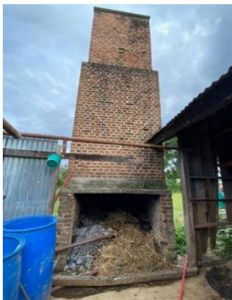
Gambar 3 2 Tampak dari dalam cerobong api

Bangunannya yang masih berdiri kokoh hingga sampai ini tentunya menjadi sebuah pertanyaan bagi sebagian orang-orang (Susanti et al., 2020). Bagaimana bisa bangunan tua tersebut masih bisa berdiri tanpa ada kerusakan pada badan bangunan. Hebatnya orang belanda ialah mereka sebelum membangun sebuah bangunan, pekerja belanda melakukan perancangan dan perhitungan yang matang serta memilih bahan bangunan yang bagus (Raka Gunawarman & Putri, 2019). Untuk itu, bahan yang digunakan adalah semen merah yang dicampur gamping yang menjadi satu. Batu bata merah digiling halus menjadi serbuk lalu dicampur dengan batu kapur sebagai bahan perekat bangunan (Wijaya & Syahrizal, 2019).