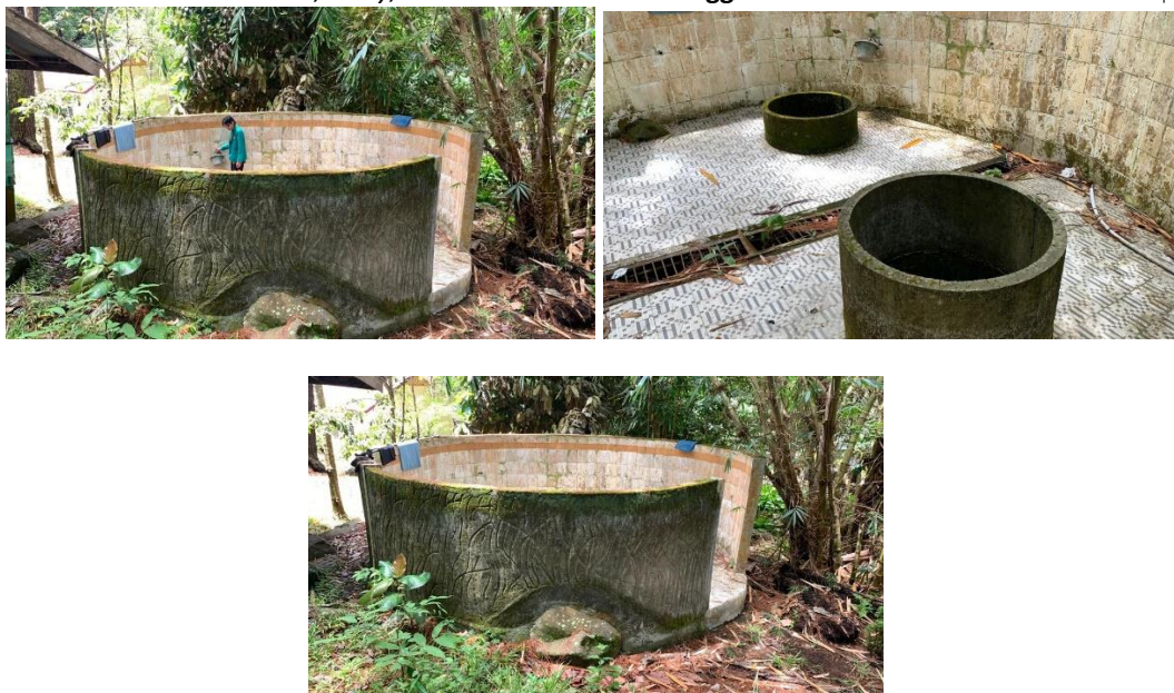
Gambar 3 10 Sumur

Berdasarkan buku profil KPH Tahura Pocut Meurah Intan (Dinas Lingkungan Hidup dan Kehutanan, t.t.), menyebutkan bahwa tahura memiliki potensi wisata yang dapat menjadi daya tarik untuk wisatawan berkunjung. Dapat dilihat pada potensi alam, buatan manusia, dan potensi kebudayaan. Potensi alam berupa ada berbagai jenis flora dan fauna serta bentangan alam berupa air terjun dan view pegunungan dari gunung seulahwah agam dan inong yang mengapit KPH. Potensi alam dapat dijadikan sebagai kegiatan wisata pendidikan dan penelitian. Potensi buatan juga tidak kalah menarik, diaman di dalamnya terdapat peninggalan kolonial Belanda. Bangunan tersebut dapat menarik wisatawan untuk melihat serta bisa dimanfaatkan sebagai obyek wisata sejarah.