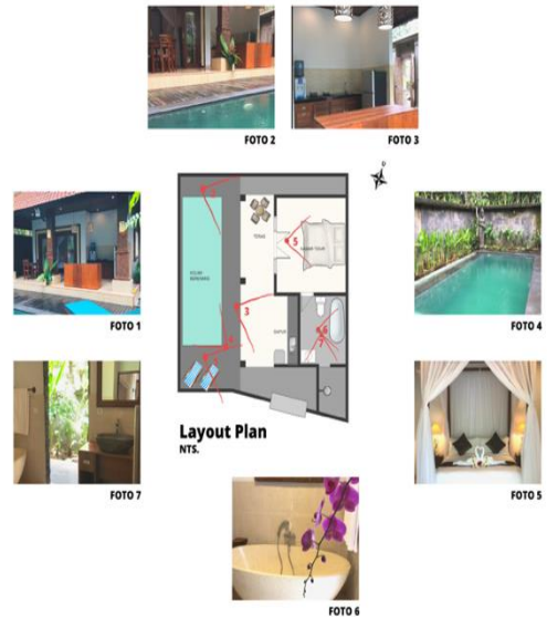
Gambar 6. Analisis Karakteristik Arsitektur Candra Loka Villa