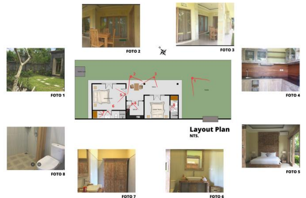
Gambar 8. Analisis Karakteristik Arsitektur Pondok Mesari