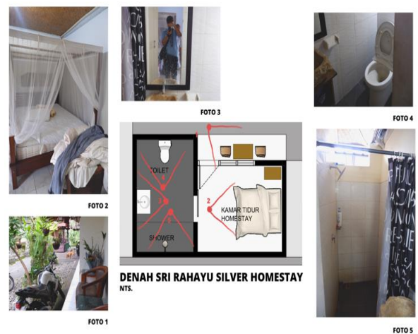
Gambar 5. Analisis Karakteristik Arsitektur Sri Rahayu Silver Homestay