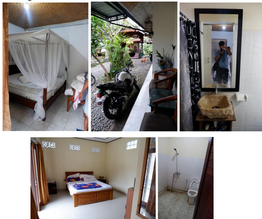
Gambar 2. Kamar Akomodasi Wisata Berbasis Masyarakat pada Permukiman Br. Karang Dalem I, Desa Bongkasa Pertiwi, Badung