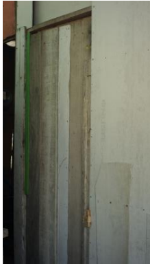
Gambar 24. Bagian 4 Rumah 4