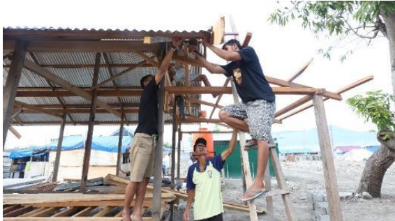
Gambar 28. Proses Pembangunan Salah Satu Huntara

didapatkan dari pohon bambu yang tumbuh di sekitar mereka, juga beberapa bongkah paving block yang sekilas terlihat utuh, serta paku-paku bekas dan terpal yang banyak bertumpuk. Bahan baku bekas tersebut dikumpulkan terlebih dahulu (Gambar 27), dipilih yang tingkat kerusakannya kecil, lalu dikeringkan jika masih basah (bekas tsunami), dibersihkan, dan dipotong pada bagian yang mengalami kerusakan sebelum digunakan kembali (Gambar 28). Kekurangan bahan baku seperti paku ataupun balok kayu seperti yang dialami penghuni rumah 3 didapatkan dari toko yang sudah buka.