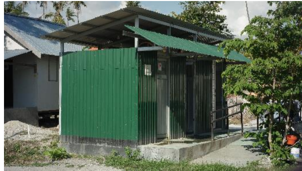
Gambar 30. Kakus Komunal di Lokasi Penelitian