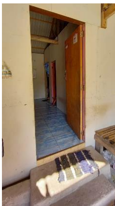
Gambar 18. Bagian 4 Rumah 3