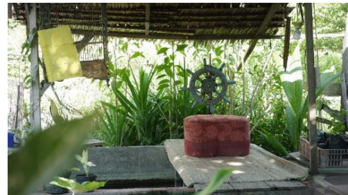
Gambar 13. Bagian 5 Rumah 2