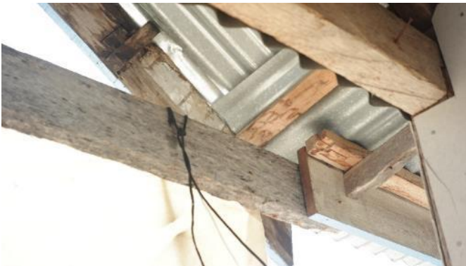
Gambar 16. Bagian 2 Rumah 3

Empat hari saja saya di pengungsian, terus pulang kampung. Sampai satu bulan, mulai hilang trauma baru saya kembali lagi. Mumpung masih ada yang bisa dikumpul-kumpul. Itu (balok atap) bekas semua; kalau lebih, dipotong untuk dipakai lagi (Gambar 16). Cuma itu saja tambahannya balok-balok baru (Gambar 15). Tapi nda tau ini semua kayu bekas rumah yang mana. Paku-paku juga ini dikumpul-kumpul saja. Kurangnya baru beli. Waktu itu sudah ada toko bangunan buka. Harganya begitulah (wajar). Biar berkarat, yang masih agak bagus dibeli saja. Saya cuma berdua sama suami waktu itu kerjakan. Belum ada yang rusak ini sejak dibangun. Angin masuk saja, panas di dalam kalau siang makanya saya di luar kan waktu Ibu (tim peneliti) datang. Kalau warnanya ini memang warna didapat saja semua, kecuali pintu-pintu (Gambar 18) saja yang dicat coklat. Dinding sama atap dari Arkom semua (Gambar 17 dan 19) Rencana di depan mau bikin rumah yang agak layak, tapi sedikit-sedikit. Ada uang baru dilanjut.