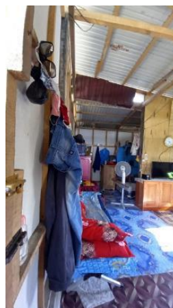
Gambar 23. Bagian 3 Rumah 4

Saya mulai bersih-bersih lahan di sini, sambung papan-papan kayu (Gambar 22 dan Gambar 24) terus ada yang datang bantu-bantu desain (orang Arkom) dari Surabaya. Kami gotong-royong bangun ini, mereka yang kasih seng dan kalsiboard sampai jadi. Kami ambil lagi itu batako-batako (paving block) biar ada beda sedikit (Gambar 21), nda kayu semua. Biar kecil ini rumah, yang penting bikin sendiri. Saya nda bisa tinggalkan ini, sudah menyatu jiwa.