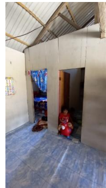
Gambar 17. Bagian 3 Rumah 3