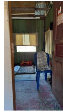
Gambar 6. Bagian 4 Rumah 1