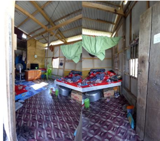
Gambar 22. Bagian 2 Rumah 4