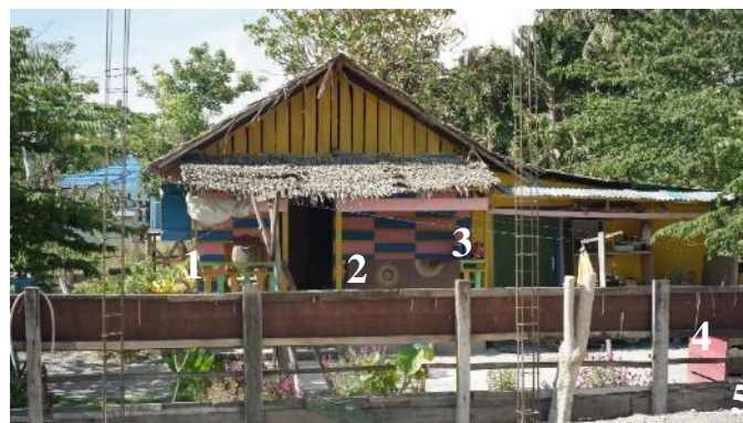
Gambar 8. Rumah 2

Awalnya kami di pengungsian, tapi tidak bagus airnya. Mau hidup itu kan yang penting air. Mau buang air besar, bagaimana kalau tidak ada air. Anak saya juga sekolahnya di sini, jadi kalau tinggal di sana, jauh lagi. Akhirnya kami pindah kecuali 2 anak perempuan saya yang sudah menikah. Mereka saya suruh tetap di sana (pengungsian) karena nda enak kalau kumpul semua di sini, sempit. Kasihan mereka kan punya suami. Tapi dua hari kemudian ke sini lagi karena nda ada air, dua hari tidak mandi.