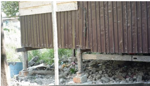
Gambar 12. Bagian 4 Rumah 2

Ini rumah sebenarnya adem karena banyak ventilasi di dinding (Gambar 9). Tapi mulai bocor-bocor atapnya (Gambar 10), kalau ada yang mau bantu alhamdulillah. Itu di depan saja pakai daun kelapa (Gambar 11).