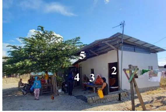
Gambar 20. Rumah 4

Saya di sini sudah dari 1977. Masih dua anakku dulu (total lima anak) waktu awal di Mamboro, sampai sekarang punya cucu. Kenapa (setelah gempa) saya tidak boleh tinggal di sini, kenapa harus mengungsi. Cucuku jauhnya itu dulu jalan ke sekolah, tidak ada kendaraan (umum) waktu itu. Jadi naik sudah saya punya emosi (tidak tahan), saya suruh semua (anak-anak) pergi cari kayu-kayu, yang penting sudah jadi dulu rangka atapnya (Gambar 25). Saya tinggalkan itu pengungsian.