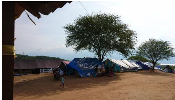
Gambar 26. Situasi Tenda Pengungsian Komunal Kelurahan Mamboro

Para penyintas pascagempa di huntara yang didampingi Arkom di Kelurahan Mamboro rata-rata membangun huntaranya selama 2 bulan. Dalam pembangunan itu, pihak Arkom hanya menyuplai material seng untuk atap dan papan untuk dinding; selebihnya diusahakan sendiri oleh penghuni huntara. Sebelumnya, mereka sudah pernah merasakan berhuni di tenda-tenda pengungsian komunal (Gambar 26) namun pergi kurang dari sepekan karena beberapa faktor seperti masalah privasi, kesulitan air, jauh dari sekolah anak, hingga keterikatan tempat dengan lokasi lama. Hal tersebut termasuk dalam kepuasan huni terhadap lingkungan hunian, yang meliputi keterjangkauan lokasi, fasilitas umum, dan kondisi bertetangga (Dewi Wulansari, 2014).