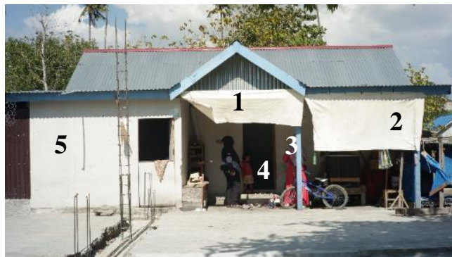
Gambar 14. Rumah 3