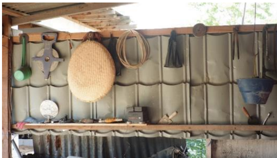
Gambar 3. Bagian 1 Rumah 1

Rumah ini dibuat 2 bulan saja pakai alat-alat yang ada di situ (Gambar 3), tapi masih rangka. Biar orang-orang lihat dulu, siapa tahu ada yang mau bantu. Rangka-rangkanya dari kayu-kayu hanyut. Arkom datang membantu, kasih 40 seng dan kalsiboard (Gambar 5 dan Gambar 7).