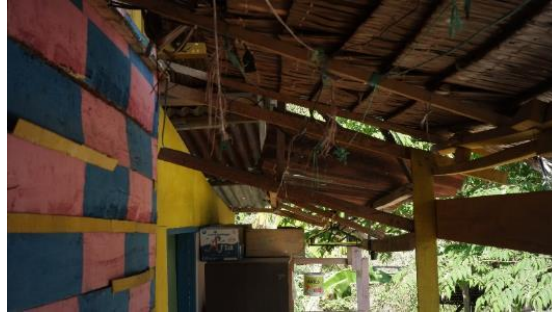
Gambar 11. Bagian 3 Rumah 2

Pelihara ikan dulu sebelum tsunami ini tidak ada, usaha baru ini. Ada yang modali, kami bagi hasil. Lumayan suasananya bikin tenang (Gambar 13). Paling cantik memang rumahku di sini. Padahal ini pakai barang-barang hanyut semua, barang bekas. Biar itu batu tumpu diambil-ambil saja yang kira-kira cocok (Gambar 12). Rencana mau bikin kolam buat wisata tapi masih terhambat dana.