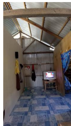
Gambar 19. Bagian 5 Rumah 3