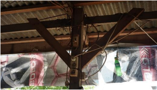
Gambar 5. Bagian 3 Rumah 1