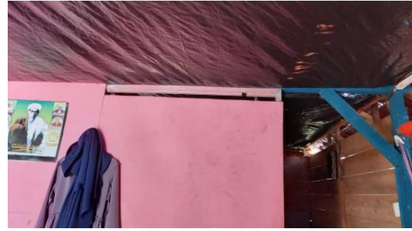
Gambar 10. Bagian 2 Rumah 2