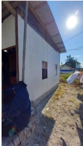
Gambar 21. Bagian 1 Rumah 4

Saya di sini sudah dari 1977. Masih dua anakku dulu (total lima anak) waktu awal di Mamboro, sampai sekarang punya cucu. Kenapa (setelah gempa) saya tidak boleh tinggal di sini, kenapa harus mengungsi. Cucuku jauhnya itu dulu jalan ke sekolah, tidak ada kendaraan (umum) waktu itu. Jadi naik sudah saya punya emosi (tidak tahan), saya suruh semua (anak-anak) pergi cari kayu-kayu, yang penting sudah jadi dulu rangka atapnya (Gambar 25). Saya tinggalkan itu pengungsian.