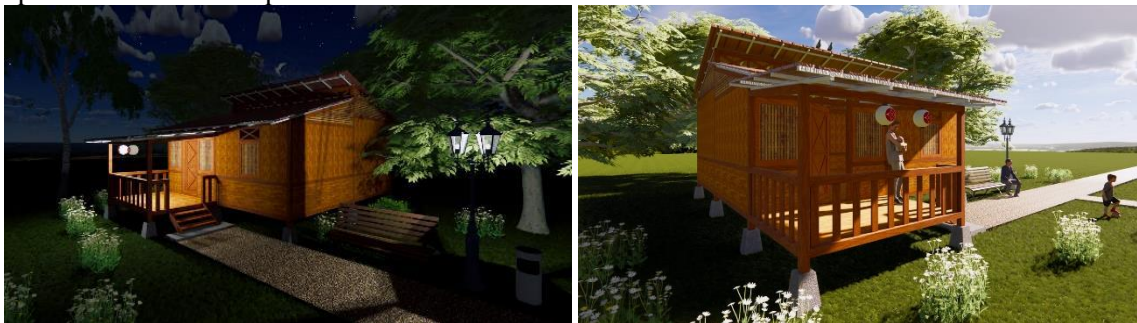
Gambar 31. Desain Modul Huntara dengan Reruntuhan Bangunan

Para penyintas pascagempa yang masih bertahan hingga 2021 di huntara Mamboro yang didampingi Arkom ingin menyimpan memori dari bangunan lama di bangunan baru dengan memanfaatkan reruntuhan material maupun komponen bangunannya, sekaligus dapat berhuni di bawah naungan yang cepat, hemat, kuat, dan tetap selamat. Penilaian EPH yang difokuskan pada aspek teknis menguatkan alasan mereka untuk menetap; segala ketidaknyamanan yang dirasakan para penyintas masih bisa ditoleransi dan cukup bisa meredam trauma pascagempa. Hasil ini diharapkan dapat memberikan pemahaman dalam penggunaan kembali reruntuhan material dan komponen bangunan pascagempa bagi perencanaan mendatang yang serupa. Dan karena itu, kami mengajukan rekomendasi desain yang didasarkan pada pengamatan kami terhadap 4 huntara di lokasi penelitian.