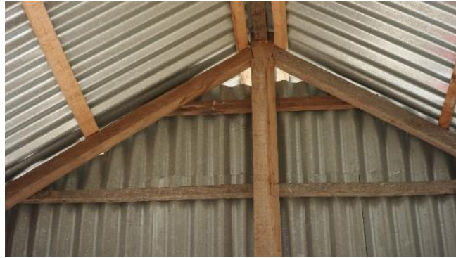
Gambar 15. Bagian 1 Rumah 3

Empat hari saja saya di pengungsian, terus pulang kampung. Sampai satu bulan, mulai hilang trauma baru saya kembali lagi. Mumpung masih ada yang bisa dikumpul-kumpul. Itu (balok atap) bekas semua; kalau lebih, dipotong untuk dipakai lagi (Gambar 16). Cuma itu saja tambahannya balok-balok baru (Gambar 15). Tapi nda tau ini semua kayu bekas rumah yang mana. Paku-paku juga ini dikumpul-kumpul saja. Kurangnya baru beli. Waktu itu sudah ada toko bangunan buka. Harganya begitulah (wajar). Biar berkarat, yang masih agak bagus dibeli saja. Saya cuma berdua sama suami waktu itu kerjakan. Belum ada yang rusak ini sejak dibangun. Angin masuk saja, panas di dalam kalau siang makanya saya di luar kan waktu Ibu (tim peneliti) datang. Kalau warnanya ini memang warna didapat saja semua, kecuali pintu-pintu (Gambar 18) saja yang dicat coklat. Dinding sama atap dari Arkom semua (Gambar 17 dan 19) Rencana di depan mau bikin rumah yang agak layak, tapi sedikit-sedikit. Ada uang baru dilanjut.