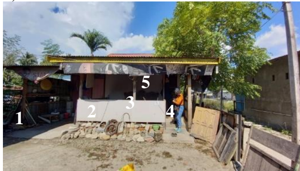
Gambar 2. Rumah 1