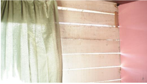
Gambar 9. Bagian 1 Rumah 2