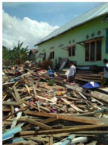
Gambar 27. Masyarakat Mengumpulkan Reruntuhan Bangunan

Reruntuhan bangunan dan material bekas yang digunakan sebagai komponen rekonstruksi mandiri huntara diambil di sekitar lokasi rumah sebelumnya. Selain komponen bangunan berbahan dasar kayu seperti balok dan papan yang mendominasi tampilan huntara, tampak pula potongan-potongan bambu yang