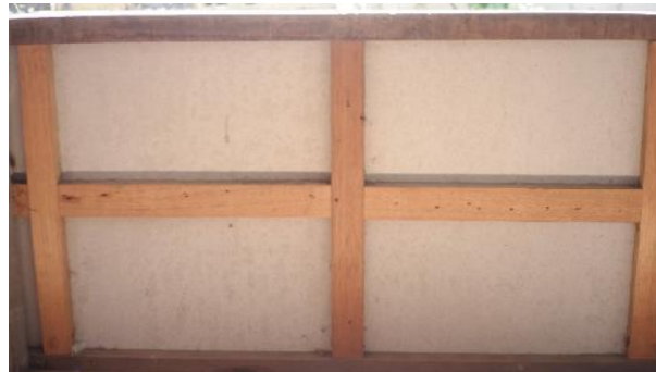
Gambar 7. Bagian 5 Rumah 1 (Sumber: survei, 2021)

Kalau yang panas dan bocor hujan di dalam (Gambar 6) ya memang sudah sewajarnya. Diterima saja, bukan masalah. Sedangkan ini listriknya saja masih ditanggung pemerintah. Biarpun namanya huntara, tapi saya mau selamanya (menetap di sini). Ditawari pindah juga saya tidak mau.