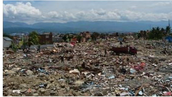
Gambar 29. Mobil Pengangkut di Lokasi Reruntuhan Bangunan

Kendala warga setempat dalam pengumpulan reruntuhan bangunan pascagempa adalah saat mereka harus berpacu waktu dengan mobil pengangkut yang terus berdatangan di lokasi yang terdapat tumpukan reruntuhan (Gambar 29); ada yang bertujuan mencari reruntuhan yang masih layak jual, ada pula yang bertujuan membersihkan. Reruntuhan bangunan bagi beberapa pihak masih dianggap limbah tak bernilai yang harus segera dibersihkan. Sementara bagi sebagian lain, reruntuhan bangunan adalah lautan harta karun yang dapat dimanfaatkan untuk mendulang keuntungan. Namun semua mobil pengangkut itu jelas merupakan ancaman bagi warga setempat yang berniat mengumpulkan reruntuhan rumah mereka yang mungkin masih tersisa dan bisa dimanfaatkan kembali.