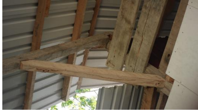
Gambar 25. Bagian 5 Rumah 4