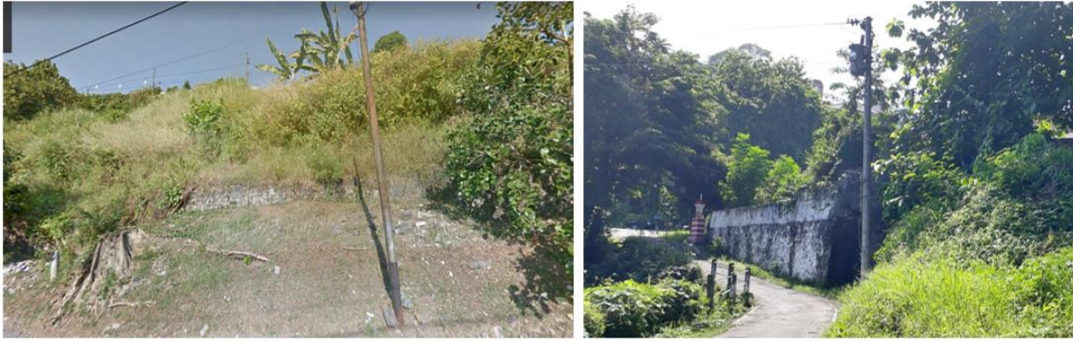
Gambar 2. Kondisi Lereng di Jalan Bukit Permata Raya