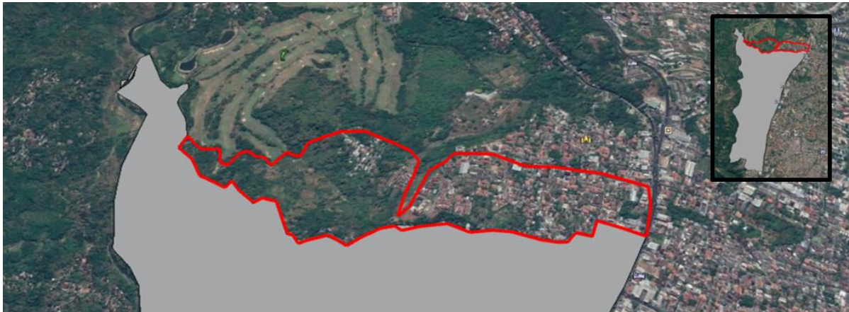
Gambar 1. Deliniasi RW 9, Kelurahan Spondol Kulon

RW 9 terletak di sebelah Barat Kelurahan Spondol Kulon serta berbatasan langsung dengan sungai Kali Garang. Luas wilayah RW 9 mencapai 416.288 m 2 . Hampir seluruh wilayah di RW 9 memiliki kelerengan 2% hingga 40%, serta memiliki ketinggian berkisar antara 99 hingga 243 mdpl. Berdasarkan profil geologis tersebut, RW 9 termasuk wilayah yang rawan terjadi longsor. Upaya konservasi lahan perlu dilakukan sebagai tindakan preventif untuk mencegah terjadinya longsor.