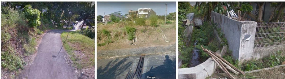
Gambar 5. Kondisi Saluran Drainase di beberapa lokasi di RW 9

Di beberapa jalan yang menjadi penghubung antara satu wilayah permukiman dengan wilayah lainnya tidak dilengkapi dengan saluran drainase (Gambar 5). Selain itu di samping jalan terdapat perbedaan ketinggian tanah yang tidak dilengkapi dengan dinding penahan, sehingga memiliki resiko terjadi erosi yang cukup tinggi.