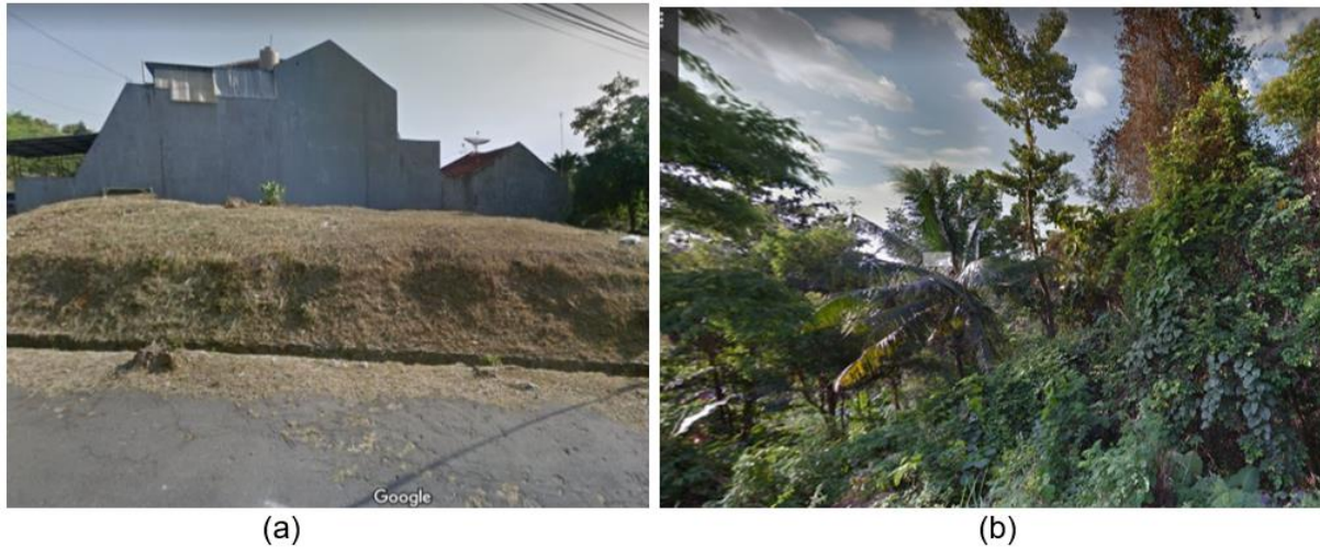
Gambar 4. Tutupan Lahan di (a) perumahan Bukit Permata Raya dan (b) Wilayah perkebunan dan hutan

Tata guna lahan di wilayah bagian Barat RW 9 pada umumnya merupakan perkebunan maupun hutan. Vegetasi yang tumbuh di daerah tersebut beragam, mulai dari trembesi, palem, hingga jati sebagai vegetasi berakar dalam, serta rumput-rumputan menjalar sebagai vegetasi berakar dangkal. Pada daerah ini, resapan air cukup besar, sehingga minim resiko terjadi longsor.