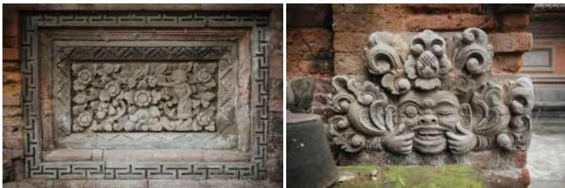
Gambar 4. Ragam Hias yang terdapat di Pura Dalem Dasar

Secara sosial di bidang pendidikan, Pura Dalem Dasar dapat dijadikan sumber belajar formal maupun non-formal dengan memanfaatkan potensi yang dimiliki Pura Dalem Dasar. Secara non-formal pendidikan dapat diperoleh melalui kegiatan ngayah di Pura baik itu gotong royong, membuat banten, tari-tarian, maupun bermain alat musik. Sedangkan secara formal terdapat beberapa potensi yang dimiliki Pura Dalem Dasar, antara lain : (1) aspek historis melalui berdirinya pura maupun proses perkembangan dan perubahan pelinggih-pelinggih yang ada di Pura Dalem Dasar; (2) aspek peninggalan dimana terdapat beberapa peninggalan-peninggalan yang dapat dijadikan sumber belajar, antara lain : relief pada pelinggih atau tembok penyengker yang menceritakan kisah sesuai sastra, penggunaan material pada Pura Dalem Dasar yang masih asli sejak abad 18, sistem pengecatan pada pelinggih-pelinggih yang masih menggunakan teknik alami, serta sistem struktur pada gedong yang masih asli.