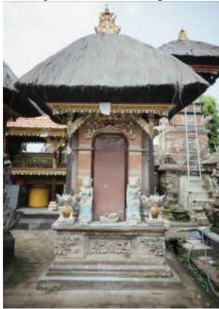
Gambar 3. Pelinggih Hyang Ibu

atau (2) Pelinggih Hyang Ibu , merupakan stana leluhur sebagai Dewa Hyang atau batara-batari. Pada pelinggih Hyang Ibu ini bertujuan untuk memuja betara-betari dengan soroh atau klan Pasek .