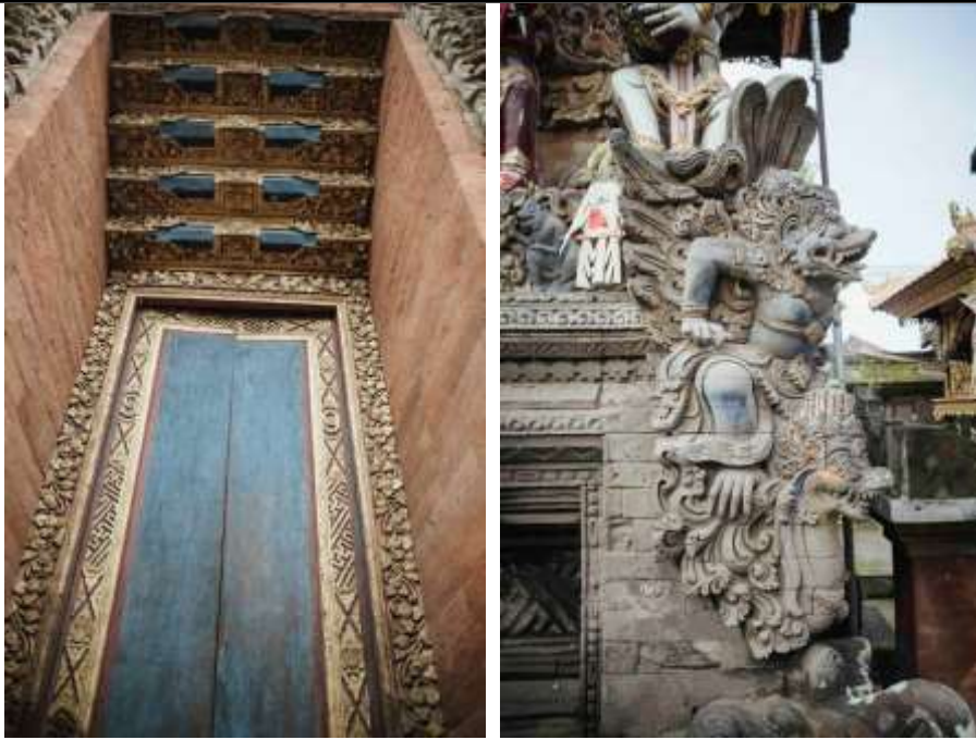
Gambar 5. (Kanan) Pewarnaan dengan warna emas & biru menggunakan bahan kimia (Kiri) Pewarnaan dengan warna alami berbahan dasar permata