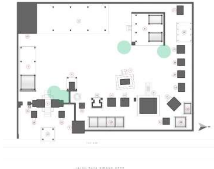
Gambar 6. Struktur Mandala pada Pura Dalem Dasar

Secara arsitektural, Pura Dalem Dasar yang dijadikan objek kajian memiliki nilai warisan budaya yang bersifat arsitektural yang dimana apabila hilang akibat bencana yang disengaja ataupun tidak maka nilai tersebut akan sulit diteruskan ke generasi selanjutnya karena tidak ada dokumentasi yang mempunyai. Secara nilai arsitektural, misalnya saja pada struktur halaman atau mandala dari Pura Dalem Dasar. Pada dasarnya struktur pembagian halaman pura pada Pura Dalem Dasar sama seperti pura pada umumnya di Bali. Pura Dalem Dasar merupakan pura yang menggunakan konsep dwi mandala yaitu pembagian pura yang terbagi menjadi dua bagian yaitu Utama Mandala (Jeroan) dan Nista Mandala (Jaba Sisi) . Konsep Dwi Mandala yang melambangkan alam atas ( urdhah ) dan alam bawah ( adhah ).