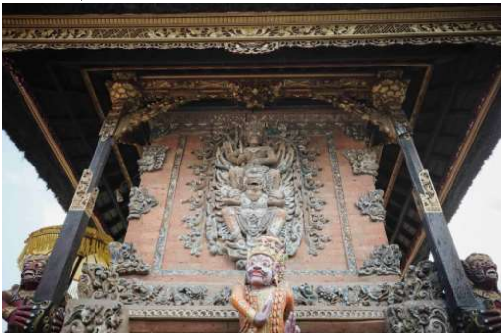
Gambar 2. Pelinggih Patih

Fungsi Pura Dalem Dasar secara religius sebagai tempat persembahyangan umat Hindu yang melakukan pemujaan terhadap Ida Sang Hyang Widhi dan segala manifestasinya serta tempat untuk mensucikan diri secara niskala. Pura Dalem Dasar tidak hanya mempunyai fungsi religius keagamaan saja, namun juga memiliki fungsi religius sesuai dengan kepercayaan masyarakat setempat. Hal ini dapat dilihat dengan keberadaan pelinggih dengan fungsinya tersendiri, misalnya saja : (1) Pelinggih dengan wujud Patih yang memiliki fungsi sebagai pelinggih pemujaan untuk memohon pengobatan dan memohon keturunan, khususnya keturunan laki-laki,