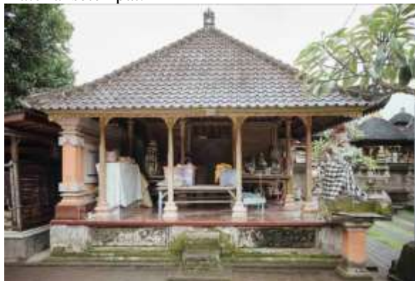
Gambar 7. Bale Gede yang dimana atapnya telah berubah karena alasan ketidakterediaan bahan asli lagi. Meskipun mengalami perubahan, nilainya tetap sama.

Perkembangan dan perubahan pura situs khususnya yang disengaja, sebaiknya tetap memperhatikan konteks setempat dan menyesuaikan dengan kebaruan yang ada. Misalnya saja, pada kasus ketidakterediaan bahan. Seringkali ditemukan kasus perubahan material diakibatkan ketidakterediaan bahan asli, sehingga ada baiknya dilakukan studi kasus mendalam terlebih dahulu untuk menyesuaikan bahan yang digunakan sesuai dengan aturan setempat ( awig-awig ) dan konteks material setempat.