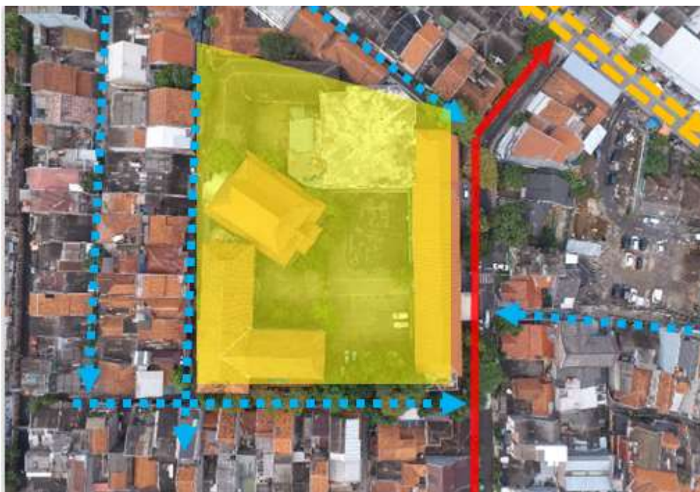
Gambar 2 Alur Transportasi Sekitar Kompleks Muhammadiyah Antapani