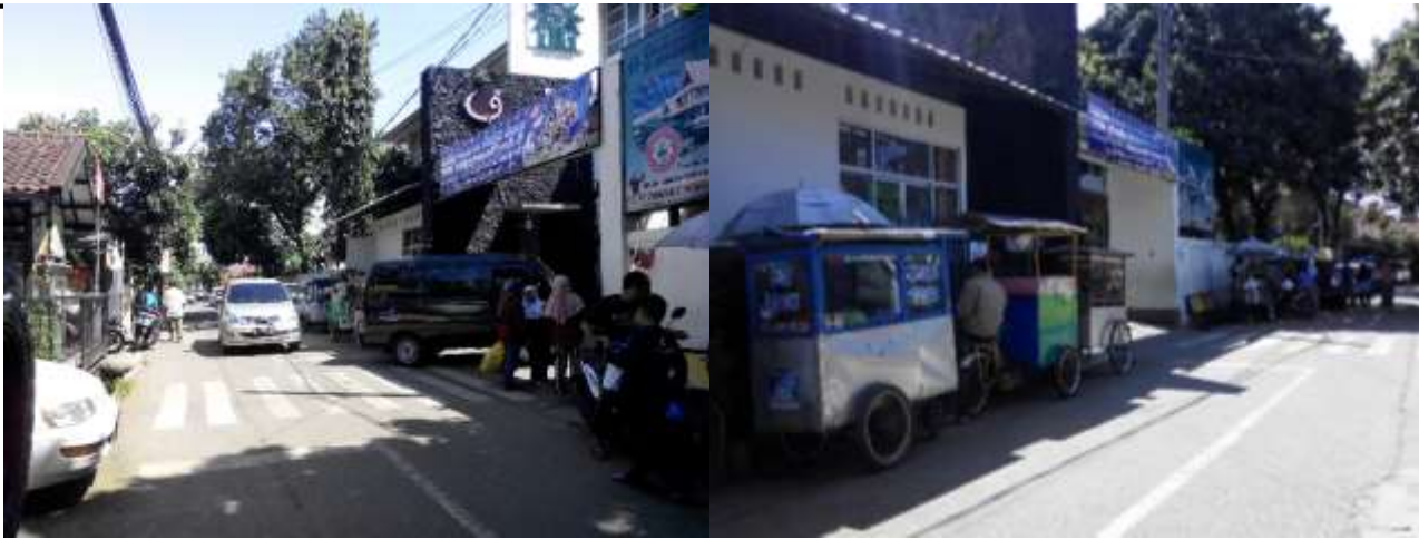
Gambar 4: Kondisi lebar jalan kadipaten di depan gerbang kompleks muhammadiyah antapani & pedagang kaki lima yang berjualan di badan jalan kadipaten

Saat ada dua kendaraan/mobil yang berpapasan (di luar jam berlakunya oneway), tidak dapat maju bersamaan karena hampir sebagian badan jalan di pakai parkir mobil, atau di pakai berjualan. Karena tidak di sediakannya tempat untuk berjualan, seluruh pedagang kaki lima menggunakan badan jalan untuk berjualan. Oleh karena itu saat kegiatan jajan siswa muhammadiyah pada jam istirahat dan saata jam pulang sekolah akan mengganggu kelancaran transportasi di jalan tersebut.