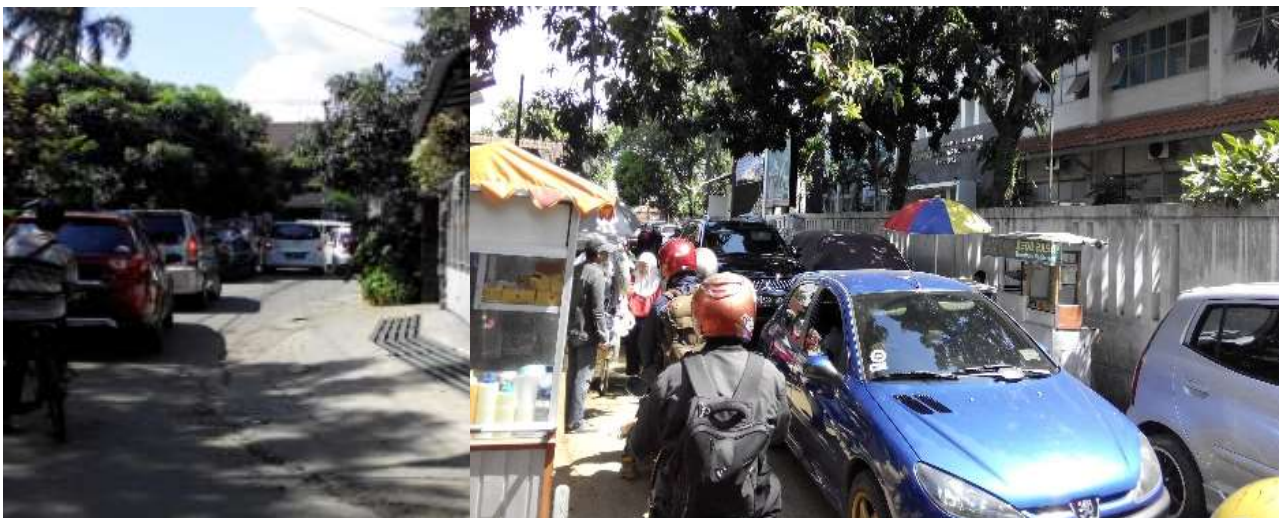
Gambar 3 Kemacetan Di Pagi Hari Kondisi saat ada kendaraan yang masuk ke kompleks Muhammadiyah Antapani

Pada jam tersebut juga terapkan system oneway di jalan kadipaten yang di usulkan oleh pihak muhammadiyah. Sedangkan menurut warga sekitar, mereka pun memiliki hak untuk menggunakan jalan tersebut tanpa harus ikut terkena kemacetan kendaraan yang mengantri untuk masuk, atau mengantar siswa muhammadiyah sebagai mana mestinya terutama pada pagi hari di mana mayoritas warga berangkat kerja.