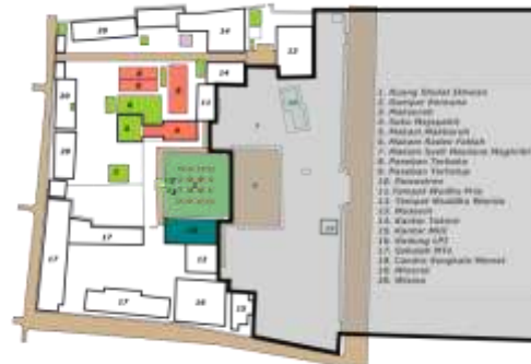
Gambar 06. Area Kegiatan Grebeg Besar di Masjid Agung Demak