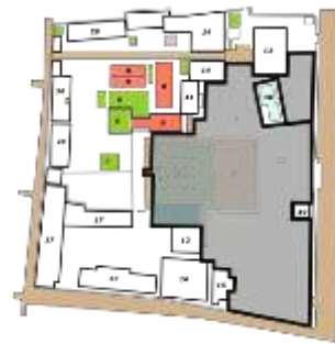
Gambar 02. Area sholat Ideul Adha di Masjid Agung Demak