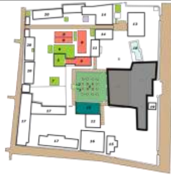
Gambar 04. Area Kegiatan Hafla Zikir di Masjid Agung Demak

Disamping itu terdapat juga acara pengajian dalam bentuk hafla zikir & manaqib istiqomah diselenggarakan oleh majelis zikir Al khidmah Demak setiap bulan pada minggu ke tiga. Pada intinya acara tersebut banyak melafazkan zikir kepada Ilahi yang dilakukan khususnya di masjid Demak. Acara ini dilakukan di sekitar pelataran masjid (Gambar 04) karena bersifat terbuka dan dapat disebut juga sebagai ruang interaksi bersama. Banyaknya para jamaah yang menghadiri di dalam ruang pelataran, maka dapat disebut pula sebagai ruang zikir. Ruang zikir artinya sebagai ruang yang dekat dengan Ilahi, dimana manusia melakukan perenungan yang langsung berhubungan dengan Ilahi. Para peserta yang hadir baik dari kalangan wanita dan pria yang masing-masing di pisahkan hingga terbagi dalam kelompok namun secara keseluruhan semua peserta majelis menggunakan jenis pakaian yang berwarna putih dan menggunakan tutup kepala dengan warna yang sama. Pemisahan ruang pada acara ini menjadi penting, yaitu membedakan area laki-laki dan wanita. Di ruang pelataran masjid Agung Demak merupakan ruang terbuka yang bisa digunakan oleh kelompok pria dan wanita. Meskipun demikian nilai kesucian dari bangunan ini masih terasa, yaitu sebagai ruang religius yang menghubungkan antara manusia dengan Sang Pencipta.