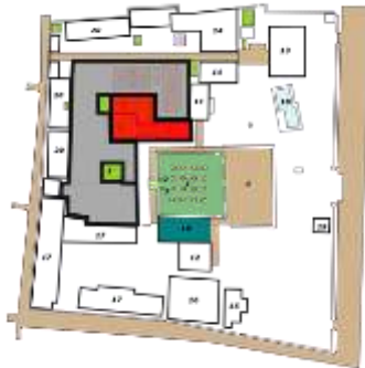
Gambar 05. Area lokasi kegiatan Haul di makam Sultan Trenggono & Raja Demak

Ruang utama untuk tahlilan malam Jumat Kliwon berada didalam cungkup makam Sultan Trenggono. Kondisi di dalam makam tidak mencukupi banyaknya orang yang ikut berdoa. Hampir semua ruang kosong dipenuhi oleh para peziarah. Dalam melakukan acara ini, panita takmir masjid berada di ruangan khusus di dalam makam Sultan Trenggono, sedangkan para peziarah berada di ruang selain makam Sultan Trenggono. Kliwonan di makam Trenggono adalah pertemuan antara para jamaah yang mengikuti acara tahlilan pada, yang dianggap sebagai ritual sakral karena di dalamnya terdapat pembacaan ayat-ayat suci dari Al Quran. Jamaah yang hadir mengikuti dan memberikan doa yang dipimpin oleh seorang Kiai.