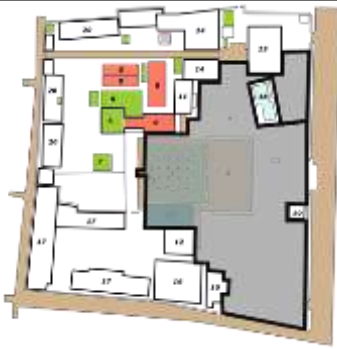
Gambar 03. Area Kegiatan malam likuran di Masjid Agung Demak