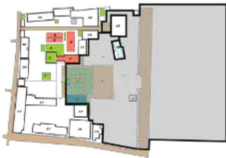
Gambar 01. Area sholat Ideul Fitri di Masjid Agung Demak