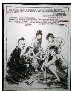
“Mari Kita Habiskan Malam Ini Bersama-sama”

Teks yang muncul dalam karya ini adalah analogi pengkarya pada sekelompok masyarakat yang memiliki konotasi negatif. Pengkarya mencoba masuk ke dalam kajian perihal pembagian wilayah administratif paling kecil di Republik Indonesia. Kelurahan dan Desa merupakan wilayah administratif tingkat akhir dalam pembagian wilayah di Republik Indonesia. Lazimnya wilayah tersebut dipimpin oleh seorang Lurah atau Kepala Desa. Di sisi lain, ada kelompok-kelompok kecil yang merasa secara inisiatif memiliki kekuasaan di wilayah-wilayah tertentu. Hal tersebut yang kerap kali muncul dari penceritaan yang didapat oleh pengkarya saat mengamati kawasan Cicadas. Pembagian wilayah secara sepihak merujuk pada pembagian kawasan wilayah mata pencaharian. Dalam tingkatan jenis pekerjaan yang muncul di kawasan Cicadas, beberapa kelompok masyarakat memilih untuk bekerja secara serabutan, mengandalkan pekerjaan harian yang tidak jarang membuat mereka harus merasakan masa tunggu kala pekerjaan tersebut tak kunjung datang. Masa transisi ini yang menggerakkan inisiatif untuk membentuk kelompok-kelompok kecil dalam tatanan masyarakat. Berangkat dari kelompok kecil tersebut, tidak jarang muncul konflik yang berawal dari praktik kepentingan masing-masing kelompok.