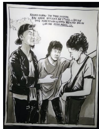
“Dipalak Preman Sepulang Berkunjung ke Rumah Pacar”

3. Figur atau tokoh; dalam proses pengamatannya, pengkarya menjumpai berbagai sosok individu maupun kelompok masyarakat yang tinggal di Kawasan Cicadas. Tanpa disadari, sosok – sosok tersebut memberikan gambaran tersendiri yang pada akhirnya dapat merubah persepsi pengkarya pada Kawasan Cicadas, khususnya terkait praktik premanisme yang kerap kali terdengar di Kawasan tersebut.