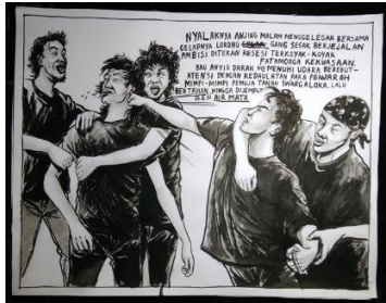
“Berebut Wilayah Kekuasaan”

dalam amatan pengkarya masih menyimpan misteri, terutama jika kita mengamati pola kesenjangan sosial yang muncul di tengah interaksi masyarakat kawasan Cicadas.