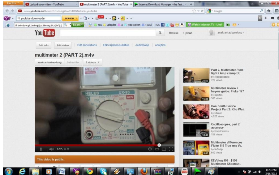
Gambar 2. Tampilan Video Pembelajaran Pada Media Sosial YouTube

video pembelajaran ini dan memperkecil kapasitas video pembelajaran yang akan di upload selain itu agar video pembelajaran ini support pada saat di upload ke media sosial YouTube . Berikut yang ditunjukkan pada gambar 2 salah satu gambar video pembelajaran yang di upload di media sosial YouTube :