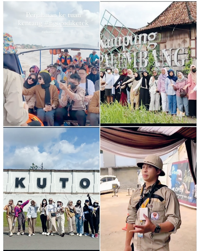
Gambar 7.2. Kegiatan Walking Tour PGG

boat in Palembang, Ketek and around the Musi River from upstream to downstream ), Palembang Harum ( produces traditional Palembang cakes: Kojo, Engkak, Bikang, Gandus, Dadar Jiwo, Kumbu, Srikayo dan lainnya ), Rumah Ong Boen Tjit dan Indonesian National Military-Naval Force in Palembang .