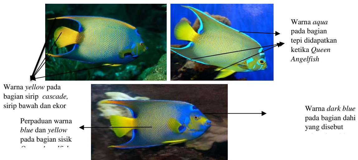
Gambar 1 Berbagai warna dari Queen Angelfish

Di bawah ini adalah beberapa contoh warna-warna yang dimiliki oleh Queen Angelfish :