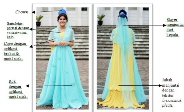
Gambar 5 Analisis Model Busana

Busana pesta sore model gaun panjang dibuat tanpa lengan dengan cape menutupi bahu dan lengan sampai di atas siku. Cape dihiasi dengan Aplikasi potong motif brokat dan motif menyerupai warna sisik Queen Angelfish secara serak. Secara keseluruhan kain yang digunakan untuk membuat gaun panjang ini yaitu kain taffeta berwarna aqua , kain ini dipilih karena memiliki tekstur kaku sehingga dapat membentuk rok dengan model melebar dibagian bawah. Rok pada busana pesta ini terdiri dari empat layer yaitu layer paling bawah menggunakan kain taffeta dan tiga layer di atasnya menggunakan kain tulle . Layer-layer kain tulle pada rok ini dihiasi aplikasi potong motif yang menyerupai warna sisik Queen Angelfish . Aplikasi motif tersebut dibuat serak dengan ukuran motif yang beragam. Pada bagian bahu terdapat kain panjang menjuntai ( jubah ) hingga melebihi panjang busana pesta, terdiri dari dua layer yang dibuat dari kain bertekstur broomstick pleats . Kain ini dibuat untuk memunculkan bentuk stilasi dari sirip dan ekor Queen Angelfish yang memiliki warna yellow . Hiasan tambahan untuk pelengkap model busana pesta ini yaitu sebuah mahkota ( crown ) bermotif khas dari mahkota Queen Angelfish dengan tambahan slayer menjuntai hingga menyentuh lantai. Slayer ini digunakan untuk memunculkan warna aqua yang ada pada tepi sirip Queen Angelfish .