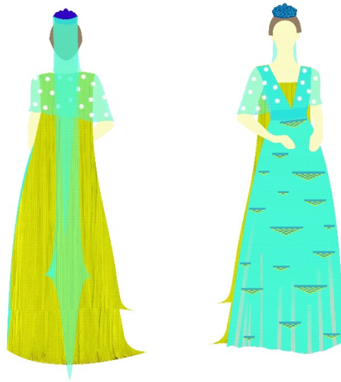
Gambar 3 Desain Produk