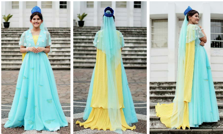
Gambar 4 Foto Produk Tampak Depan, Belakang dan Samping