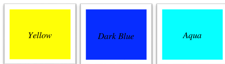
Gambar 7 Warna yang Digunakan

Pemilihan warna pada busana pesta ini mengacu berdasarkan pada sumber ide yang digunakan yaitu warna dari Queen Angelfish . Warna yang dimiliki oleh Queen Angelfish terdiri dari warna blue , dark blue , yellow dan aqua , tetapi warna dominan yang digunakan pada pembuatan busana pesta ini yaitu warna aqua dan yellow . Kedua warna tersebut dipilih karena warna aqua dan yellow memiliki visualisasi yang lebih cerah untuk diaplikasikan pada warna busana pesta sore dibandingkan warna blue dan dark blue .