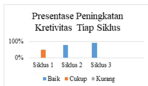
Grafik 6.2 Presentase kenaikan kreativitas pada siklus I siklus II dan siklus III

Keempat , subindikator ke-4 mengenai menggunakan berbagai alternatif huruf, warna, ilustrasi dan gambar yang sesuai dengan topik yang diperoleh. Kelima , subindikator ke-5 mengenai memiliki strategi dalam merancang flipchart dengan baik. Keenam , subindikator ke-6 mengenai mampu berdiskusi dan berargumen dengan baik. Ketujuh , subindikator ke-7 mengenai menyajikan narasi secara kronologis dan menarik. Kedelapan , subindikator ke-8 mengenai memilih kombinasi dan komposisi flipchart dengan baik. Selanjutnya akan dipaparkan presentase kenaikan kreativitas siswa melalui penerapan proyek flipchart dalam pembelajaran sejarah pada tiap siklusnya dengan dipresentasikan dalam bentuk grafik sebagai berikut.