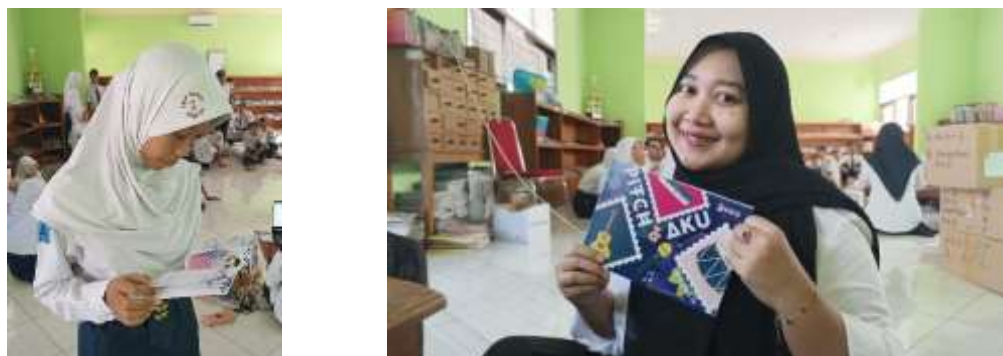
Gambar 28 dan 29. Kegiatan Observasi Buku "Pitch & Aku"