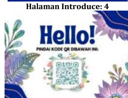
Gambar 1,2,3, dan 4. Wujud halaman introducing 1-4 dalam buku Pitch & Aku .

Selanjutnya setelah mendengarkan surat selamat datang, pengguna akan diarahkan ke halaman daftar isi untuk melihat serangkaian aktivitas yang nanti dilakukan secara langsung oleh pengguna buku. Ragam aktivitas yang tertulis dalam kalimat instruksi buku ini adalah bacalah, gambarlah, berlatihlah, dengarkanlah, dan tuliskanlah. Penambahan imbuhan -lah di belakang kalimat instruksi diharapkan dapat menimbulkan kesan ajakan daripada perintah.