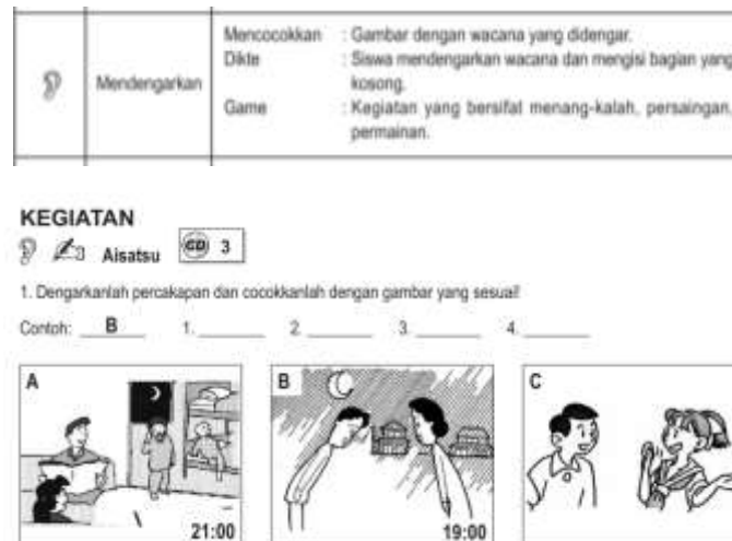
Gambar 25 dan 26. Referensi diksi instruksi yang digunakan dalam buku pembelajaran bahasa Jepang - SAKURA vol.1

kita memahami aktivitasnya. Disamping itu karakter budaya Jepang yang selalu memikirkan kepraktisan dan efisiensi menjadi nilai yang ingin dimunculkan dalam produk ini.