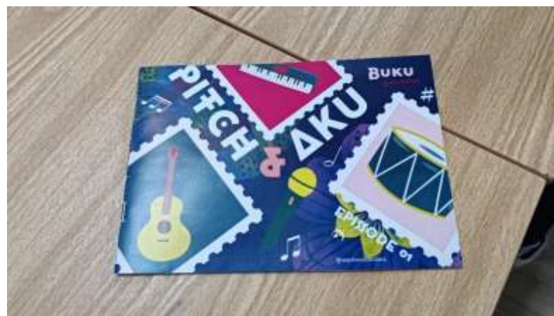
Gambar 27. Buku "Pitch & Aku" Setelah Selesai Dicetak oleh Tim Grafika Pandaan

Namun terlepas dari segala kesulitan, Grafika Pandaan bisa merealisasikan buku "Pitch & Aku" dengan sebaik-baiknya. Harga jasa untuk layout dan cetak adalah Rp.60.000.- Sehingga peneliti masih akan melakukan survei ke beberapa tim percetakan lain untuk menemukan harga produksi yang lebih murah, mengingat sudah memiliki desain layout dari tim percetakan sebelumnya.