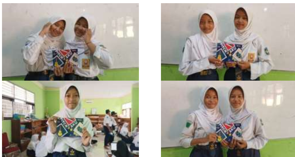
Gambar 30-33. Kegiatan Implementasi Buku dalam kegiatan Ekstrakurikuler Paduan Suara

Berikut beberapa dokumentasi ketika buku "Pitch & Aku" diimplementasikan dalam pembelajaran Paduan Suara. Pemilihan implementasi di ekskul paduan suara ini guna melihat respon siswa yang setidaknya sudah mengenal musik.