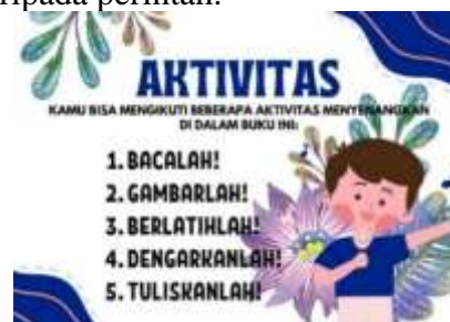
Gambar 5. Daftar Isi Buku "Pitch & Aku"

Selanjutnya setelah mendengarkan surat selamat datang, pengguna akan diarahkan ke halaman daftar isi untuk melihat serangkaian aktivitas yang nanti dilakukan secara langsung oleh pengguna buku. Ragam aktivitas yang tertulis dalam kalimat instruksi buku ini adalah bacalah, gambarlah, berlatihlah, dengarkanlah, dan tuliskanlah. Penambahan imbuhan -lah di belakang kalimat instruksi diharapkan dapat menimbulkan kesan ajakan daripada perintah.