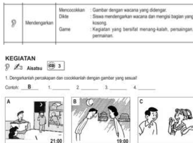
Gambar 25 dan 26. Referensi diksi instruksi yang digunakan dalam buku pembelajaran bahasa Jepang - SAKURA vol.1

kita memahami aktivitasnya. Disamping itu karakter budaya Jepang yang selalu memikirkan kepraktisan dan efisiensi menjadi nilai yang ingin dimunculkan dalam produk ini.