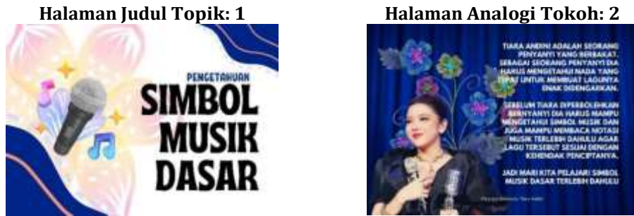
Gambar 6 dan 7. Halaman Judul Topik dan Analogi Tokoh dalam Buku “Pitch & Aku”

Setelah itu pembaca akan disajikan beberapa informasi dan jenis instruksi yang akan diikuti. Beberapa aktivitas akan melibatkan kegiatan menulis, memindai QR code, mendengarkan, dan membaca. Landasan memilih kalimat instruksi aktif seperti “Bacalah” adalah untuk mencerminkan implementasi teori belajar konstruktivisme milik Jean Piaget mengenai proses asimilasi (proses penyerapan informasi dengan memadukan persepsi dan stimulus dalam bentuk verbal, auditif, dan visual), hingga nanti bisa berlanjut ke proses akomodasi (proses penyusunan kembali pola pikir setelah mendapatkan informasi baru. Proses ini terjadi jika ada kondisi dimana persepsi tidak terjadi sesuai skema awal) hingga terbentuknya proses ekuilibrasi. Disamping itu ketika nanti tutor musik memandu siswa dalam aktivitas pemindaian QR code, ditujukan agar dapat mempererat kualitas bonding time antara tutor musik dan siswa di dalam kelas. Berikut adalah keseluruhan dari materi/isi buku “Pitch & Aku”: