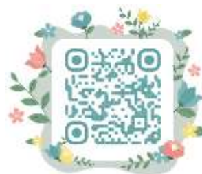
Gambar 23 dan 24. Referensi QR code yang digunakan dalam buku Pitch & Aku. Variasi Hitam Original dan Hijau Mint-Floral

Mengenai inspirasi penyajian informasi dan instruksi dalam buku yang memiliki arah berbasis aktivitas dengan prosentase lebih banyak melibatkan elemen praktik dan latihan, peneliti mengambil referensi dari perpaduan buku pembelajaran musik dan buku pembelajaran bahasa jepang. Menggunakan referensi dari buku pembelajaran musik memang harus dilakukan karena harus memuat diksi yang relevan dengan teori musik yang ada, mengingat di akhir proses buku tersebut akan dikonsumsi oleh siswa musik yang notabene adalah calon musisi masa depan. Sedangkan pertimbangan menggunakan buku pembelajaran bahasa jepang adalah peneliti sempat kagum dengan diksi instruksional yang ada dalam buku-buku mereka. Misalkan pada buku SAKURA vol.1 yang perintah dalam kegiatannya hanya diinstruksikan dengan ikon namun sudah bisa membuat