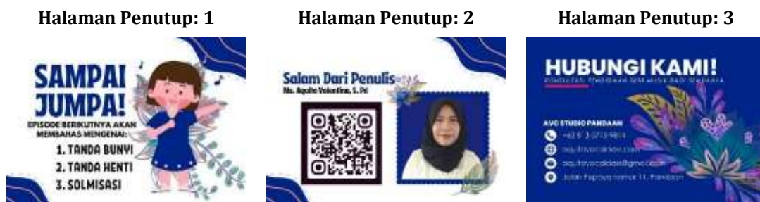
Gambar 17, 18, dan 19. Halaman Penutup 1-2 dalam Buku "Pitch & Aku

Pada halaman penutup, pembaca akan mendapatkan cuplikan singkat mengenai topik yang akan dipelajari di buku episode 2, ucapan salam penutup dari penulis berupa audio yang bisa diakses secara real-time melalui QR code, dan juga tertera nomor handphone tim penyusun yang bisa dihubungi untuk mengakomodir layanan penerimaan saran, masukan, kendala ketika menggunakan buku.