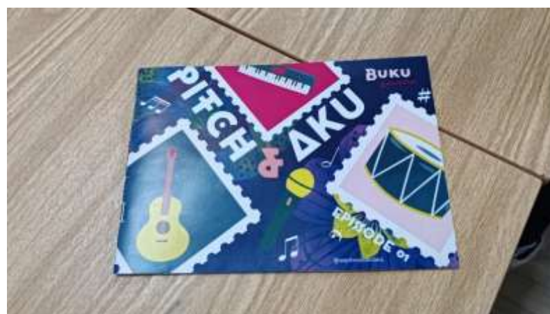
Gambar 27. Buku "Pitch & Aku" Setelah Selesai Dicetak oleh Tim Grafika Pandaan

Namun terlepas dari segala kesulitan, Grafika Pandaan bisa merealisasikan buku "Pitch & Aku" dengan sebaik-baiknya. Harga jasa untuk layout dan cetak adalah Rp.60.000.- Sehingga peneliti masih akan melakukan survei ke beberapa tim percetakan lain untuk menemukan harga produksi yang lebih murah, mengingat sudah memiliki desain layout dari tim percetakan sebelumnya.