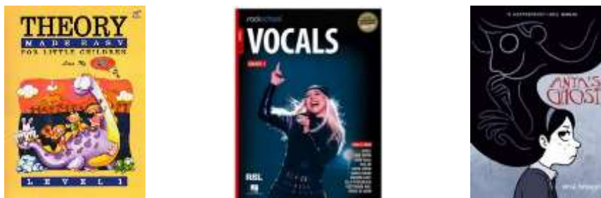
Gambar 20, 21, dan 22. Referensi beberapa sampul buku yang menjadi inspirasi rancangan awal buku “Pitch & Aku”

yang bisa membuat gambar ilustrasi yang sesuai dengan kebutuhan nuansa cerita dan tokoh karakter.