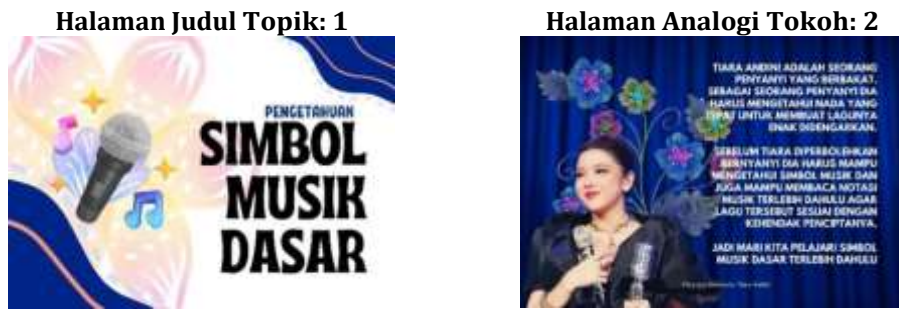
Gambar 6 dan 7. Halaman Judul Topik dan Analogi Tokoh dalam Buku “Pitch & Aku”

Setelah itu pembaca akan disajikan beberapa informasi dan jenis instruksi yang akan diikuti. Beberapa aktivitas akan melibatkan kegiatan menulis, memindai QR code, mendengarkan, dan membaca. Landasan memilih kalimat instruksi aktif seperti “Bacalah” adalah untuk mencerminkan implementasi teori belajar konstruktivisme milik Jean Piaget mengenai proses asimilasi (proses penyerapan informasi dengan memadukan persepsi dan stimulus dalam bentuk verbal, auditif, dan visual), hingga nanti bisa berlanjut ke proses akomodasi (proses penyusunan kembali pola pikir setelah mendapatkan informasi baru. Proses ini terjadi jika ada kondisi dimana persepsi tidak terjadi sesuai skema awal) hingga terbentuknya proses ekuilibrasi. Disamping itu ketika nanti tutor musik memandu siswa dalam aktivitas pemindaian QR code, ditujukan agar dapat mempererat kualitas bonding time antara tutor musik dan siswa di dalam kelas. Berikut adalah keseluruhan dari materi/isi buku “Pitch & Aku”: