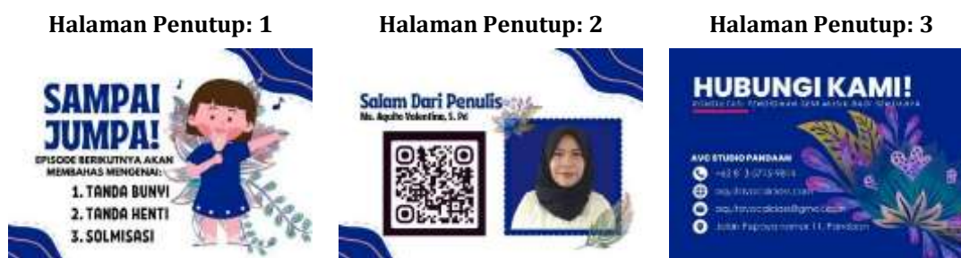
Gambar 17, 18, dan 19. Halaman Penutup 1-2 dalam Buku "Pitch & Aku"

Pada halaman penutup, pembaca akan mendapatkan cuplikan singkat mengenai topik yang akan dipelajari di buku episode 2, ucapan salam penutup dari penulis berupa audio yang bisa diakses secara real-time melalui QR code, dan juga tertera nomor handphone tim penyusun yang bisa dihubungi untuk mengakomodir layanan penerimaan saran, masukan, kendala ketika menggunakan buku.