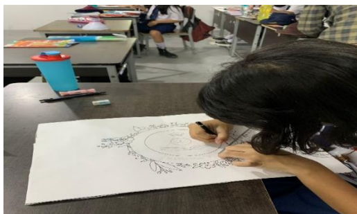
Gambar 1.

Siswa membuat dahulu gambar sesuai dengan kreasi mereka sendiri ,lalu gambar tersebut di desain sedemikian rupa dengan teknik yang sudah diajarkan oleh guru.