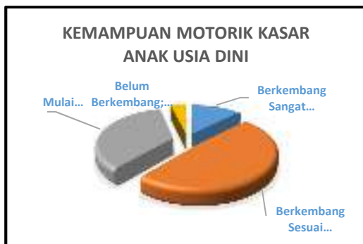
Grafik 4.2 Kemampuan Motorik Kasar Anak Usia Dini di Taman Kanak-kanak Kecamatan Gunung Sindur Kabupaten Bogor

Jika digambarkan dalam bentuk grafik, maka Kemampuan Motorik Kasar Anak Usia Dini di Taman Kanak-kanak Kecamatan Gunung Sindur Kabupaten Bogor tersaji dalam Grafik 4.2 berikut.