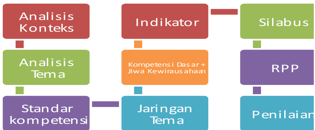
Diagram Langkah Pengembangan Pembelajaran Tematik

Menurut Dixon dan Collin (1997 : 8) untuk merencanakan pembelajaran tematik langkah awal adalah menentukan tema yang menarik dan sesuai dengan minat peserta didik serta disesuaikan dengan tingkat perkembangan psikologi anak. Dalam pengembangan pembelajaran tematik, penentuan tema yang sesuai dengan jiwa kewirausahaan antara lain: Makananku, kegiatanku, berbelanja, sampah, transportasi, sahabatku, hewan dan tumbuhan, serta hasil bumi. Tema-tema tersebut bersifat umum namun dalam penyusunan silabus perlu mempertimbangkan psikologi anak, contohnya kelas 1 SD berbeda karakteristiknya dengan kelas 3 SD, contohnya untuk tema berbelanja cakupan materi untuk konsep belanja berbeda. Untuk kelas 1 SD konsep belanja lebih menekankan pada konsep membeli sebuah benda. Sedangkan untuk kelas 3 SD konsep belanja menekankan pada pemilihan benda yang akan dibeli. Sama halnya dengan jiwa kewirausahaan, untuk kelas 1 SD yang dikembangkan indikator berani dan komunikatif, sedangkan kelas 3 SD yang dikembangkan adalah indikator mandiri, inovatif, menyampaikan gagasan, komunikatif dan berani. Hal lain yang perlu diperhatikan dalam pemilihan tema antara lain tema harus bermakna dan tidak terlalu luas cakupannya. Selain itu tema harus mempertimbangkan ketersediaan sumber belajar.