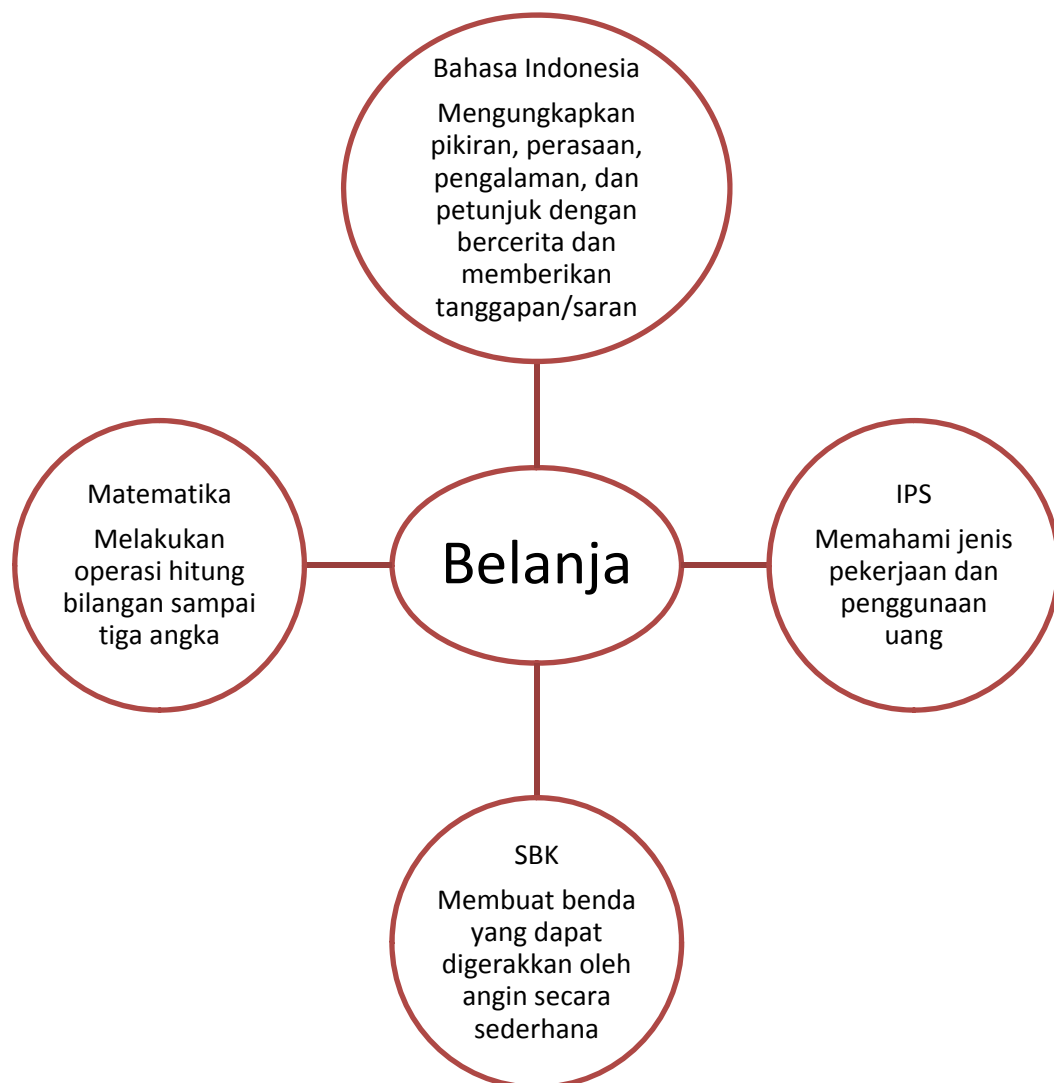
Diagram : Tema dan deskripsi materi dari 4 mata pelajaran

Dalam menguraikan SK menjadi KD dapat digunakan matriks analisis seperti tabel dibawah ini.