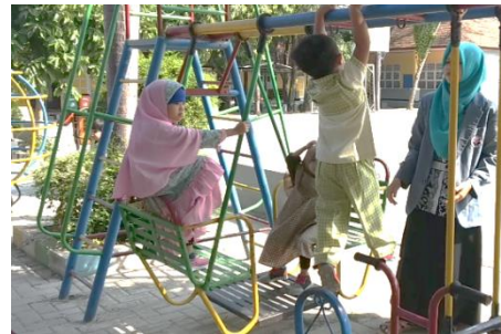
Gambar 3. Kegiatan guru dan anak pada siklus II di luar kelas

Untuk mengatasi masalah pada siklus I, maka dilakukan tindakan pada siklus II. Siklus II dilaksanakan pada tanggal 25-29 Juli 2019. Seperti siklus I, siklus II juga dilakukan tiga pertemuan dengan penilaian pada pertemuan ketiga. Peneliti RPPH dengan tema diriku dan subtema anggota tubuh. Peneliti juga membuat cerita untuk senam fantasi dengan judul "Bertamasya ke Bukit". Aktivitas dilakukan di luar ruangan dengan menggunakan alat yang tersedia di luar lapangan. Sehingga bisa menstimulasi gerakan yang belum optimal.