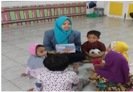
Gambar 1. Kegiatan guru dan anak pada pra siklus menggunakan flash card

Adapun berdasarkan hasil observasi, terlihat sembilan anak belum seluruhnya memiliki kemampuan gerakan tubuh secara terkoordinasi, lentur, seimbang, lincah, lokomotor, non-lokomotor, dan mengikuti aturan. Hasil dari observasi kondisi awal kemampuan motorik kasar anak kelompok A Muharram masih kurang. Dalam instrumen penelitian yang telah divalidasi terdapat 10 indikator kemampuan motorik kasar yang digunakan selama observasi yaitu menirukan gerakan binatang (A), gerakan pohon tertiuip angin (B), gerakan pesawat terbang (C), bergelayut (D), melompat kedepan (E), meloncat dengan 2 kaki (F), berlari cepat sampai batas tertentu (G), melempar bola sampai batas tertentu (H), menangkap bola dari batas tertentu (I), dan menendang bola sampai batas tertentu (J). Berikut hasil observasi motorik kasar pada pra siklus: