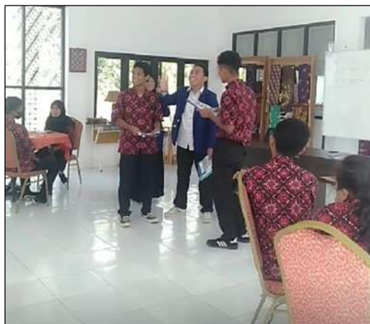
Gambar 2. Jeux de role menjemput tamu

Pada pembelajaran ini, siswa sudah mulai terbiasa dengan prononciation bahasa Prancis sehingga pembelajaran lebih efektif. Pada awal pembelajaran siswa dan dosen melakukan diskusi terkait cara menjemput tamu dan ekspresi yang digunakan dalam bahasa Indonesia. Berdasarkan pemahaman siswa tersebut, kemudian, dosen memperkenalkan ekspresi dan kosa kata cara menjemput tamu dalam bahasa Prancis.