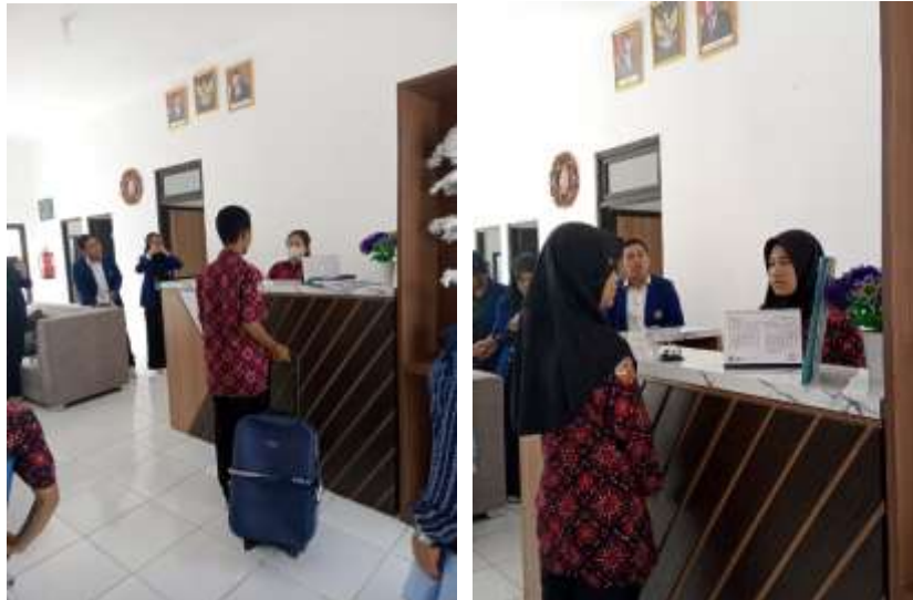
Gambar 4. Jeux de role layanan kantor depan