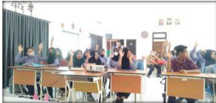
Gambar 1. Penyampaian materi dan diskusi

melakukan jeux de role , ada yang semangat, ada yang masih malu-malu. Setelah selesai, dosen mereviu dan memberikan penguatan dengan memperbaiki ucapan ( prononciation ) dan ekspresi serta tata bahasa ( grammaire ) yang salah.