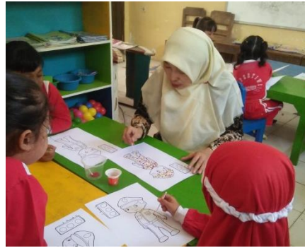
Gambar 1. Contoh Pembelajaran Melukis dengan Cotton Bud