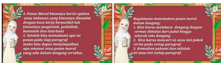
Gambar 3. Tampilan Video Pembelajaran Bagian Menemukan Pesan Moral

Pada tampilan video animasi Gambar 2 pembelajaran diatas berisi mengenai penjelasan apa itu pesan moral. Sementara Gambar 3 video animasi pembelajaran tersebut berisi bagaimana menemukan pesan moral pada dongeng, penjelasan ini berdasarkan kesulitan yang dialami siswa dalam kegiatan membaca pemahaman yaitu berupa kesulitan dalam membaca pemahaman dengan tingkatan interpretasi yaitu menemukan pesan moral pada teks dongeng.