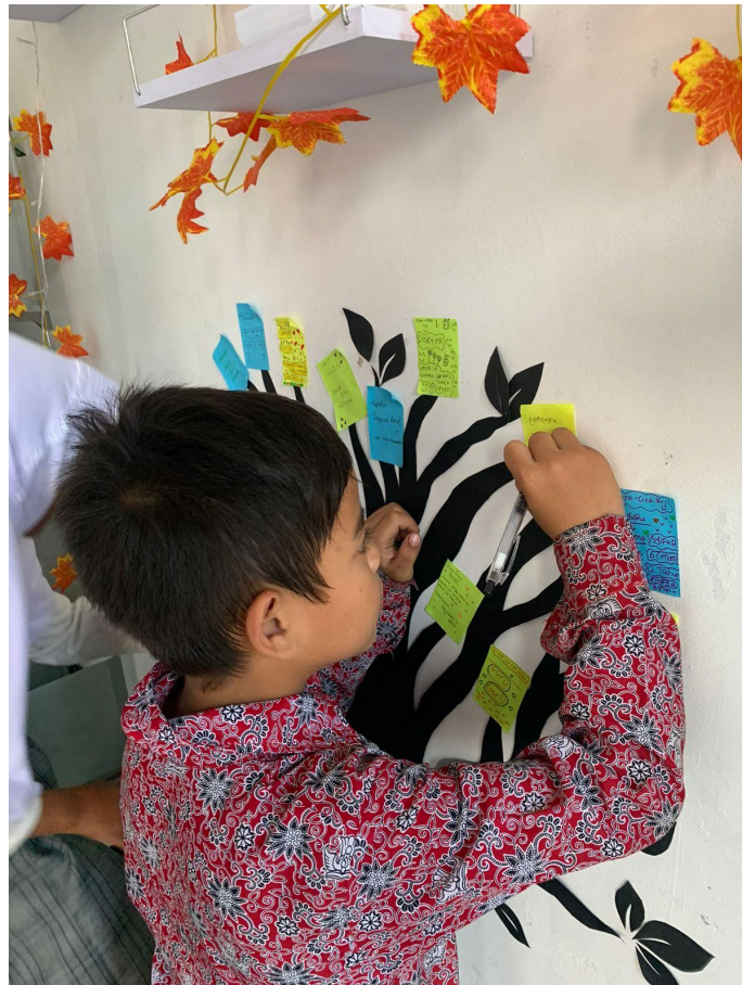
Gambar 4. Proses Penempelan Pohon Cita-Cita

kegemaran untuk berliterasi akan memiliki pengetahuan yang luas dibandingkan anak yang tidak membaca, ini dapat terjadi karena buku adalah jendela dunia.