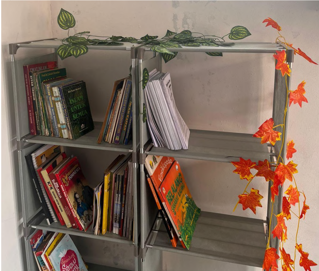
Gambar 2. Kondisi Pengadaan Buku

Buku yang disimpan pada pojok baca yang bertempat di Sekretariat Karang Taruna ini tidak hanya berupa buku pelajaran, tetapi juga buku hiburan seperti komik, majalah, novel, hingga buku mengenai bisnis. Singkatnya, Pojok baca Desa Sukadami ini diperuntukkan bagi semua kalangan dari anak-anak hingga dewasa (lihat Gambar 2 ).