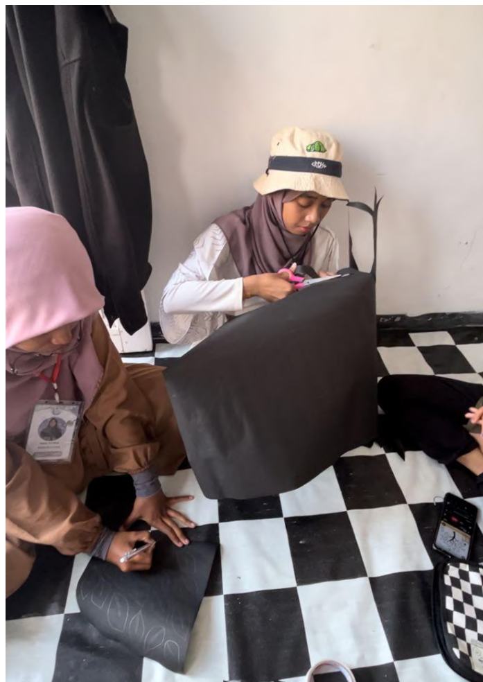
Gambar 3. Proses Pembuatan Pohon Cita-Cita

Pembuatan pohon cita-cita dimulai dengan mengumpulkan bahan sederhana berupa karton berwarna hitam dan sticky note serta perekat (lihat Gambar 3 ). Mahasiswa KKN UPI membuat pohon cita-cita dengan percaya pada filosofi sebuah pohon yang akan tumbuh jika dirawat, dari kecil hingga besar dan kemudian menghasilkan buah yang dapat dipetik. Arti dari filosofi tersebut adalah, perlu adanya sebuah proses yang mendasari cita dan harapan sebelum kemudian kita dapat memetik atau merasakan hasilnya sehingga tentu proses akhir dalam pembuatan pohon cita-cita ini ialah keterlibatan anak-anak Desa Sukadami.