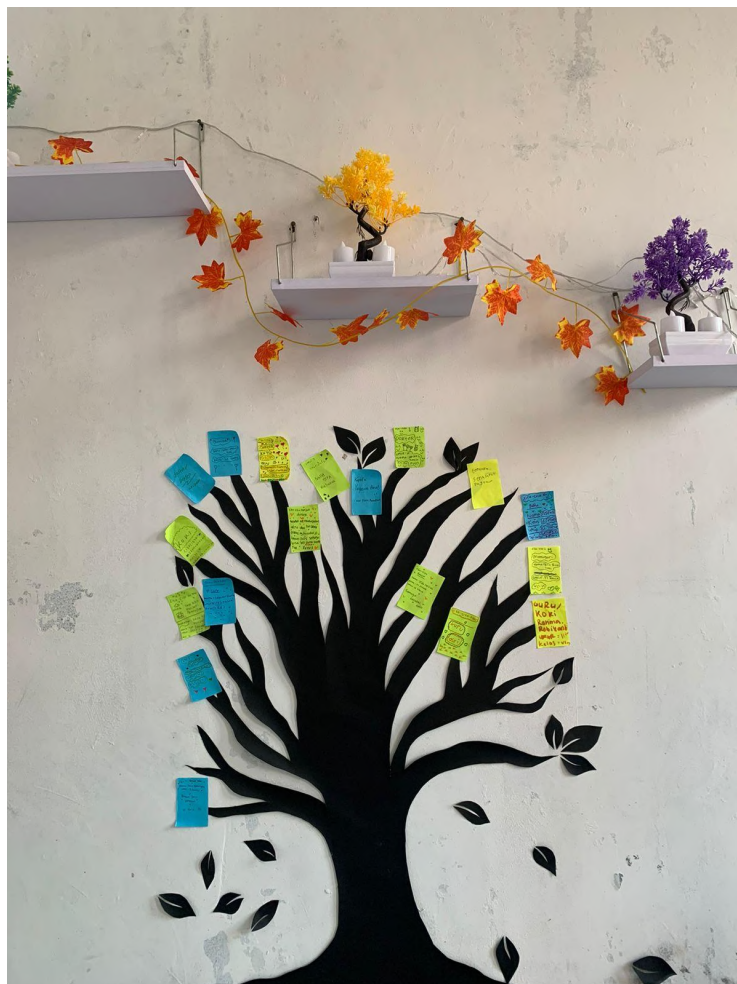
Gambar 5. Pohon Cita-Cita

Pohon cita cita memiliki manfaat yang positif untuk perkembangan anak secara langsung dalam merangkai mimpi yang akan dicapai (Aldrian et al. , 2020). Adanya arti tersirat dari pohon cita-cita membuat Mahasiswa KKN mengajak anak-anak di Desa Sukadami untuk berani memikirkan harapan dan menggantungkan cita-cita mereka yang tentunya diperlukan sebuah proses dan ketekunan dalam meraihnya. Sejalan dengan pendapat Bukhari (2023) bahwasanya pohon cita cita dapat mengajarkan anak untuk memiliki cita - cita yang dapat membantu kehidupan di masa depan menjadi lebih teratur. Dengan adanya pojok baca dan pohon cita-cita yang ditempatkan di sekretariat karang taruna ini, diharapkan minat membaca anak-anak Desa Sukadami mampu tumbuh dan memiliki cita-cita serta tujuan dalam hidup mereka.