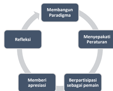
Bagan 2. Sintaks model Pembelajaran Perilaku Sosial Kewarganegaraan

jawab terhadap diri sendiri masih dianggap tidak bertanggung jawab. (Wilson, 2004). Selain itu perilaku altruistik perlu untuk memperhitungkan kebermanfaatannya dengan beberapa syarat, setidaknya terdapat 2 asumsi untuk menjelaskan ini, yaitu ambisi dan moderasi. (Dougherty, 2017). Dari sudut kontekstualitas, Hamid, S. I., & Istianti, T. (2012) melakukan analisis semantik atas muatan makna ungkapan idiomatik berdasarkan tema kewarganegaraan, yang merupakan sejumlah nilai kebaikan hingga kebajikan, baik bersifat personal, sosial dan institusional; yang direkonstruksi ke dalam 7 kategorisasi sikap moral yakni : 1) ramah, santun, tahu diri, rendah hati) ; 2) sabar, ikhlas, besar hati, terbuka, lurus / jujur ; 3) bersahabat, suka menolong); 4), pengabdian, kesiagaan dan kewaspadaan; 5) teguh membela kehormatan, kesatria, berani dan perwira; 6) ulet, tangguh, ajeg, berorientasi mutu (pekerjakeras dan cerdas) mandiri ; 7) adil terhadap sesama, arif bijaksana. Dari konstruk nilai dan kaidah pedagogis tersebutlah, maka tercipta model pembelajaran dengan sintaks seperti di bagan 2 di bawah.