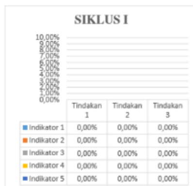
Gambar 4.4 Pengembangan Karakter Tanggung Jawab Anak

Pada siklus I, peneliti melaksanakan kegiatan cooking class hasilnya adalah anak mampu mengikuti petunjuk guru sesuai dengan yang diharapkan guru. Berikut presentase karakter tanggung jawab :