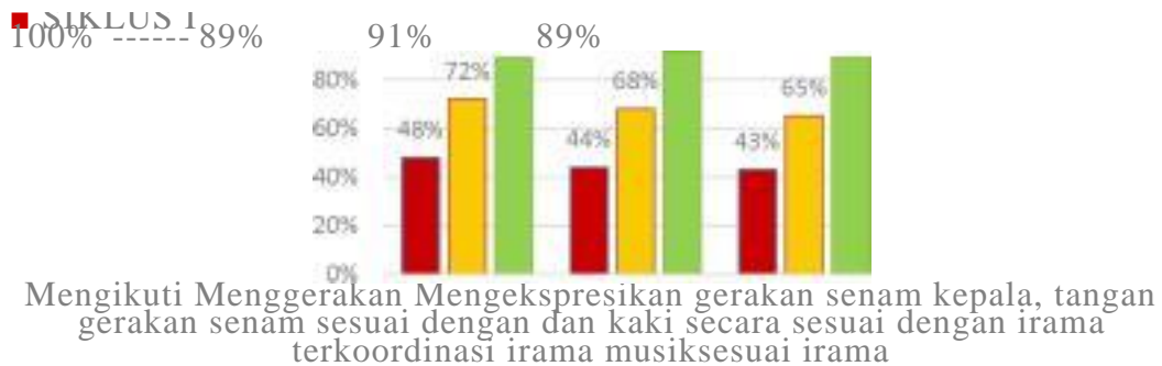
Gambar 4.1 Performa kemampuan motorik kasar anak pada siklus I-III

Berikut secara lebih jelasnya akan dipaparkan grafik dan narasi pengembangan kemampuan motorik kasar anak melalui kegiatan senam ceria yang dilakukan selama III siklus dan 3 tindakan dan akan di jelaskan secara terperinci adapun sebagai berikut: