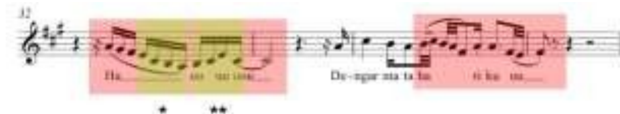
Gambar 3 - Notasi 3 pola riffs and runs Ziva Magnolya dalam lagu Matahariku ciptaan Yuan "Paser"

(*) itu merupakan pola motif pertama, namun pada pengulangan pola motif kedua (**) satu nada pertamanya berubah, lalu pada pengulangan motif ketiga (***) nada nya sama dengan pola motif kedua (**). Pada pola motif pertama (*) tertulis not C#5 pada awal penyabutan "pi" lalu turun ke B4 dan A4, setelah itu pengulangan pola motif kedua (**) namun nada pertamanya berubah jadi B4 kemudian ditahan di not B4 lagi dan turun ke A4, pada pengulangan motif ketiga (***) penyebutan "eee" pola motif kembali diulang, disana tertulis not B4 lalu turun ke A4 turun lagi ke F#4 kemudian naik ke not B4 dan berakhir pada not C#5. Pada pola riffs and runs campuran ini terdapat banyak sekali variasi nada dan ritme serta didalamnya terdapat berbagai nilai not yaitu setengah, seperempat, dan seperdelapan.