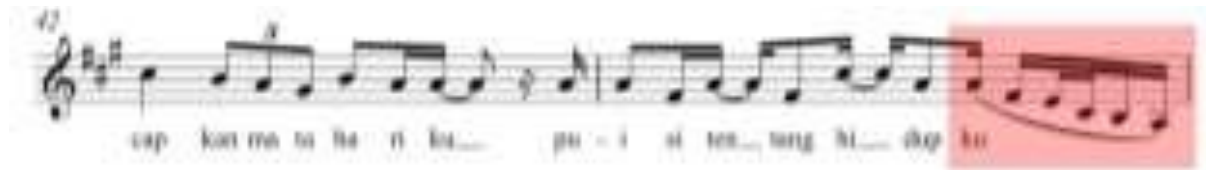
Gambar 5 - Notasi 5 pola riffs and runs Ziva Magnolya dalam lagu Matahariku ciptaan Yuan "Paser"

Sebuah pola runs terdeteksi lagi pada bar 37. Ziva kembali memasukan sebuah pola runs yang sangat menojol pada penyebutan "De" dalam kata "Dengarkan". Runs pada bagian ini sangat menonjol dengan banyak variasi nada dan juga dinyanyikan dengan tempo yang cepat memakai suara register. Pola runs pada bagian ini Ziva kembali menggunakan pola runs campuran dimana tertulis not awal pada penyebutan "de" ialah A4 turun ke F#4, E4, C#4, B3, sampai A3 sebagai not terbawah, setelah itu naik kembali ke B3 dan pola berakhir pada not C#4. Dapat dilihat nilai not pada pola runs campuran ini masih terdapat nilai not setengah, seperempat, dan seperdelapan.