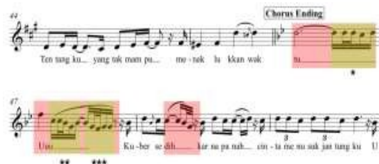
Gambar 6 - Notasi 6 pola riffs and runs Ziva Magnolya dalam lagu Matahariku ciptaan Yuan "Paser"

Selanjutnya sebuah pola runs kembali digunakan Ziva pada bar 43 dalam penyebutan "ku". Kali ini Ziva menggunakan pola runs menurun yang cukup menojol dan dinyanyikan dengan tempo yang cepat. Masih menggunakan suara register, Ziva menyanyikan pola runs ini dengan sangat yakin namun kurang terdengar jelas dikarenakan volume suara Ziva pada saat menyanyikan pola runs bagian ini kurang keras. Hal seperti ini juga bisa disebabkan karena pola runs menurun yang terlalu rendah jangkauan nadanya sehingga suara penyanyi kurang terdengar. Pola runs diatas diawali dengan not A4, lalu turun ke F#4, E4, C#4, B3, dan berakhir pada not A3. Apabila diteliti lebih mendalam, ini merupakan tangga nada pentatonik mayor alami seperti yang disebutkan oleh Matt Ramsey bahwa riffs and runs rata-rata menggunakan tangga nada pentatonik mayor.