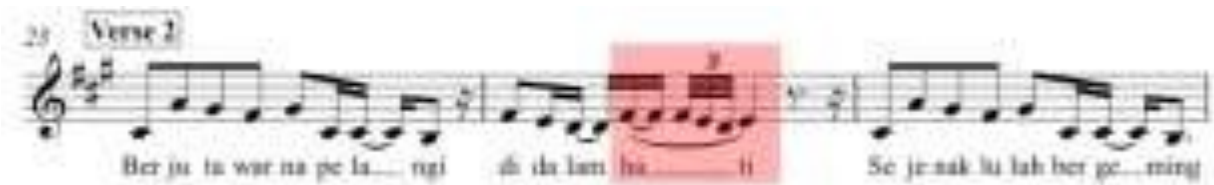
Gambar 1 . Notasi 1 pola riffs and runs Ziva Magnolya dalam lagu Matahariku ciptaan Yuan "Paser"

Lagu Matahariku ini merupakan soundtrack utama sinetron yang sempat hits pada masanya, Jelita (2008). Matahariku menjadi single utama album ketiga Agnez bertajuk Sacredly Agnezious yang rilis pada 1 April 2009. Lirik lagu Matahariku ini menceritakan tentang rasa kehilangan yang dialami seorang wanita karena ditinggalkan kekasihnya. (Sumber: Artikel KepoGaul.com). Dalam penampilan Ziva Magnolya yang membawakan lagu Matahariku ini terdapat beberapa bagian yang menggunakan teknik riffs and runs. Peneliti akan mengambil sampel bagian-bagian lagu yang menggunakan teknik riffs and runs dan mengidentifikasi polanya.