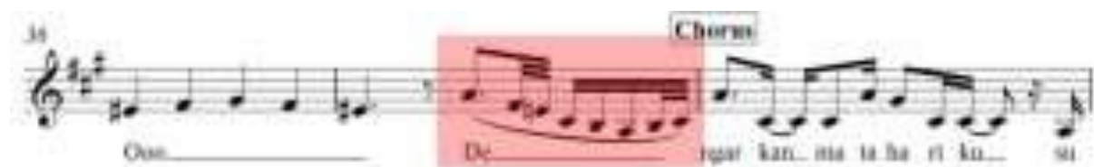
Gambar 4 - Notasi 4 pola riffs and runs Ziva Magnolya dalam lagu Matahariku ciptaan Yuan "Paser"