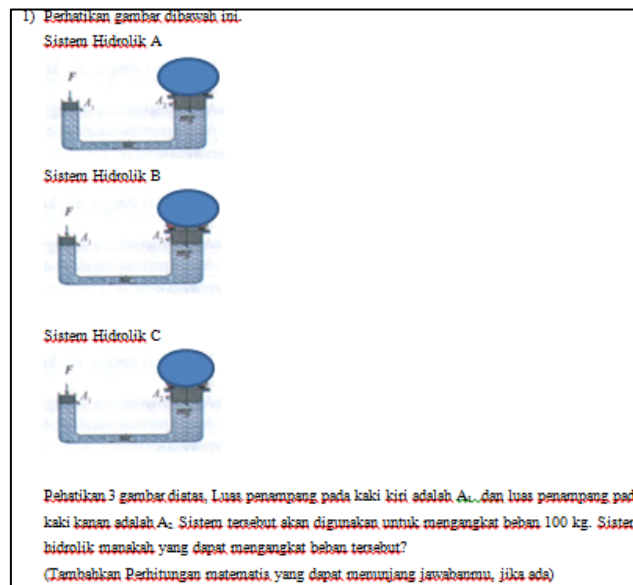
Gambar 3. Contoh soal tentang Hukum Pascal

menentukan besar tekanan pada prinsip Hukum Pascal melalui sebuah kasus. Hambatan siswa dapat dilihat melalui contoh soal dan jawaban siswa mengenai Hukum Pascal yang disajikan dalam bentuk gambar.