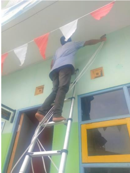
Gambar 2 a. Pemasangan CCTV di luar ruangan

Waktu pemasangan CCTV dilakukan diluar jam operasional proses belajar mengajar selama 2 hari yaitu pada hari sabtu dan minggu pada tanggal 28 – 29 September 2024 yang melibatkan dosen, mahasiswa dan beberapa anggota dari pihak Sekolah, dimana pada proses pemasangan pihak sekolah banyak membantu dalam pengerjaannya, serta dilakukan transfer pengetahuan tentang cara instalasi perangkat CCTV dan bagaimana proses pengoperasian perangkat CCTV. Pemasangan CCTV dipasang di 9 titik lokasi yang berada di dalam dan diluar ruangan dilingkungan sekolah.