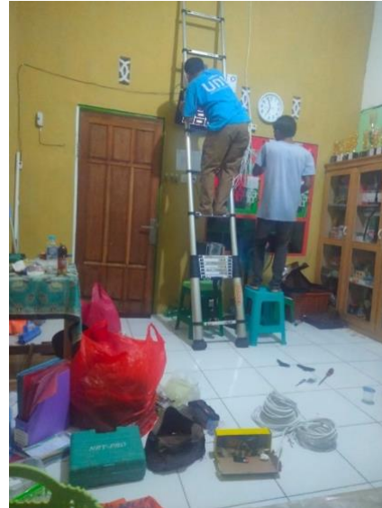
Gambar 2 b. Pemasangan CCTV di dalam ruangan