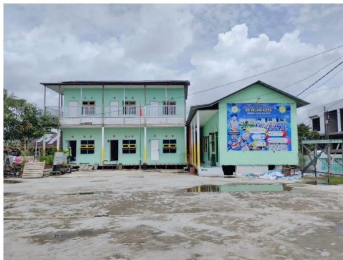
Gambar 1. Lokasi pemasangan di sekolah SD Islam AZZA di kuala Kapuas

Pelaksanaan kegiatan pengabdian ini sebelumnya dilakukan survey terhadap lokasi Sekolah untuk mengetahui lokasi titik pemasangan CCTV di dalam maupun di luar ruangan di area sekolah SD Islami AZZA serta menghitung biaya material dalam proses pemasangan CCTV dimana dalam pengabdian ini dilakukan pemasangan di 9 titik lokasi baik dalam maupun diluar ruang kelas di lingkungan SD Islam AZZA di Kuala Kapuas. Adapun untuk camera CCTV yang digunakan menggunakan jenis camera analog dengan penyimpangan menggunakan perangkat DVR yang dipasang di ruangan guru, dimana perangkat DVR akan aktif selama 24 jam non-stop serta dapat dipantau secara real time dengan menggunakan perangkat smartphone.