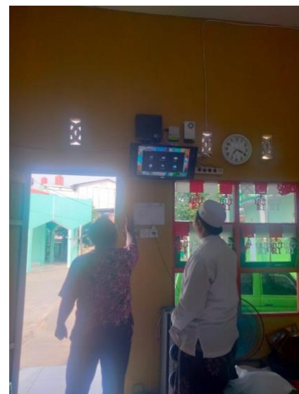
Gambar 3.b pengoperasian CCTV di DVR