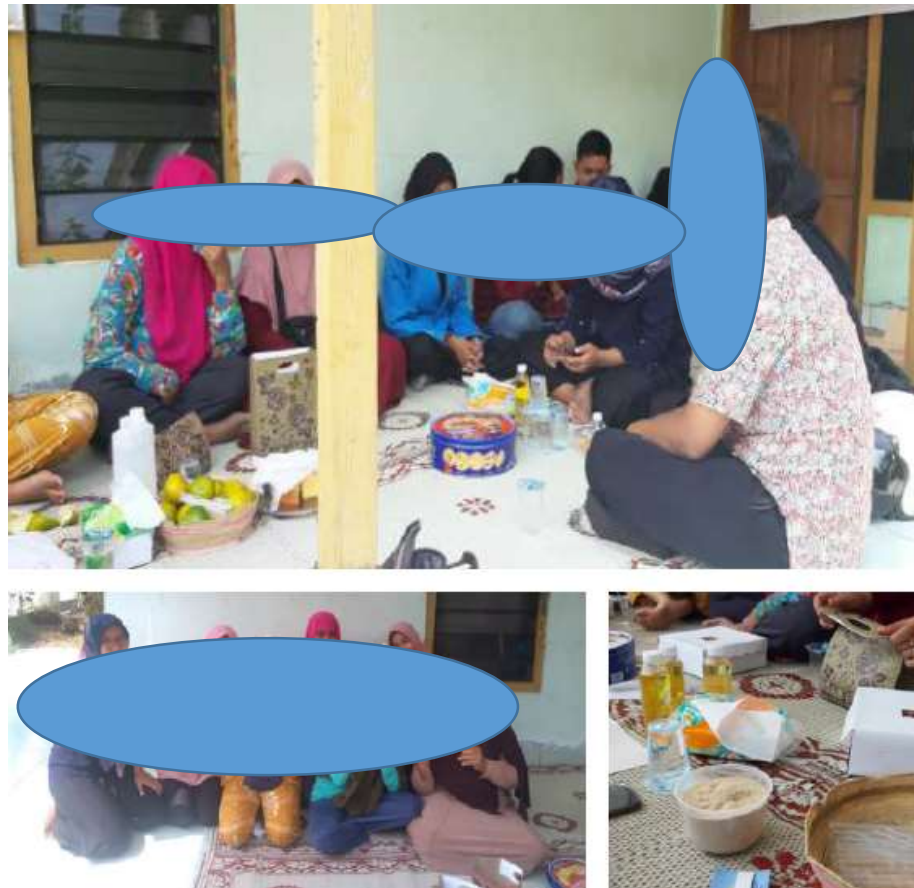
Gambar 3. Kegiatan Identifikasi Masalah

memberitahukan bahwa menerima H1 dimana setelah pendampingan memberikan dampak signifikan peningkatan pengetahuan anggota PKK.