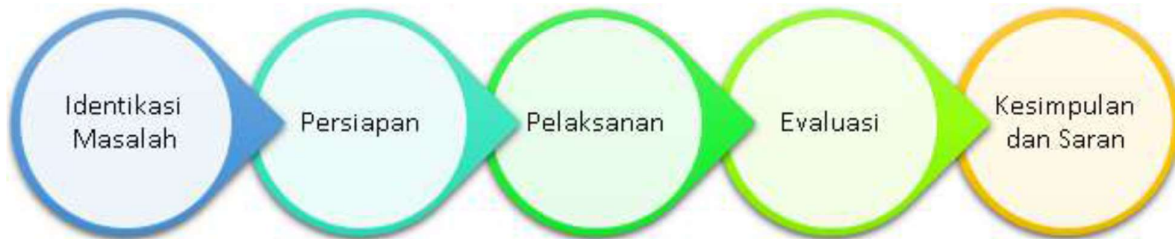
Gambar 1. Langkah Kegiatan Pengabdian

Kesimpulan bagian akhir seluruh tahapan pengabdian. Kesimpulan bertujuan untuk merangkum dan meringkas dari seluruh pembahasan dalam pengabdian sehingga pembaca dapat memahami poin-poin yang dibahas dan untuk langkahnya dibahas seperti di Gambar 1 . Solusi maupun usulan terhadap kelanjutan kegiatan pengabdian selanjutnya perlu dibahas pada bagian saran pengabdian.