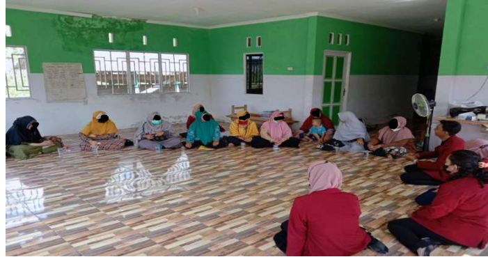
Gambar 2. Diskusi pelatihan pembuatan keripik pakis.

masyarakat sangat tinggi. Selain itu, Desa Setalik masih belum memiliki produk unggulan. Produk unggulan desa merupakan mandatory yang di turunkan oleh Kementerian Desa. Kementerian Desa melakukan sebuah gerakan revitalisasi ekonomi regional yang digagas untuk mengembangkan wilayah desa di Indonesia dalam rangka menunjang kemajuan desa agar memiliki karakteristik khusus termasuk produk pangan unggulan. Adapun kendala dalam proses kegiatan ini pada kelompok 1 dan kelompok 2 adalah keterbatasan alat, hal ini disebabkan karena alat yang ada di desa tersebut masih terbatas.