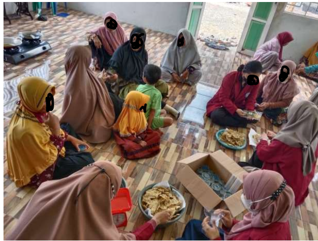
Gambar 4. Proses packaging .

Respon yang diberikan oleh ibu-ibu PKK/Kader Posyandu sangat antusias dalam mengikuti pelatihan pembuatan keripik pakis. Hal itu dapat dilihat dari ibu-ibu PKK/Kader Posyandu yang memperhatikan dengan seksama tentang pemaparan materi, bahkan ada juga yang mencatat materi yang berkaitan dengan alat dan bahan serta prosedur dalam pembuatan keripik pakis. Pelatihan ini didukung oleh pihak Desa Setalik yang bersedia menyiapkan posyandu sebagai tempat pelatihan dan sarana, seperti kompor, dandang, piring, baskom, dan lainnya.