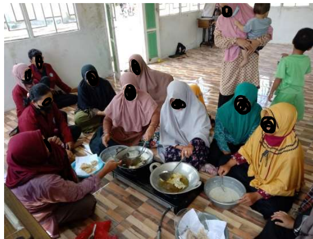
Gambar 3. Pembuatan keripik pakis.

Pelatihan pembuatan keripik pakis dilakukan secara praktik langsung kepada ibu-ibu PKK/Kader Posyandu Desa Setalik. Kegiatan pelatihan pembuatan keripik pakis diikuti secara aktif. Hal ini ditunjukkan dengan partisiasinya ibu-ibu PKK/Kader Posyandu dari awal hingga akhir acara. Pelaksanaan pembuatan keripik pakis dilakukan langsung oleh ibu-ibu PKK/Kader Posyandu yang didampingi oleh mahasiswa pelatihan yang menyampaikan takaran bahan baku dan peralatan. Pembuatan keripik pakis ini juga menggunakan bahan baku pendukung seperti tepung beras, tepung tapioka, telur, ketumbar, kemiri, bawang putih, garam, dan air. Langkah dalam pembuatan keripik pakis yaitu pencucian, pemotongan, dan perebusan pakis. Selanjutnya, haluskan bumbu dan siapkan adonan tepung beras dan tepung tapioca. Bumbu yang sudah halus tadi dimasukan ke dalam adonan tepung, kemudian masukan sedikit demi sedikit potongan pakis dan aduk sampai merata. Proses selanjutnya yaitu penggorengan yang terlihat pada Gambar 3 . Setelah penggorengan selesai, dilanjutkan dengan pengemasan pada Gambar 4 menggunakan kemasan standing pouch dan diberi label kemasan yang berisi informasi produk agar lebih menarik.