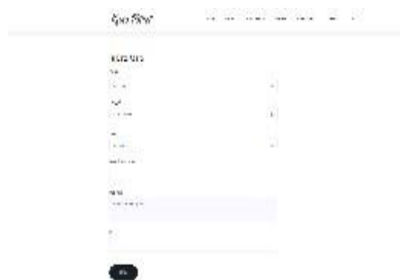
Gambar 5. Halaman pemesanan jasa.

Pada tampilan ini, pengguna dapat mengisi form untuk memesan jasa serta menentukan uang muka yang akandibayarkan dan lokasi (Lihat Gambar 5 ).