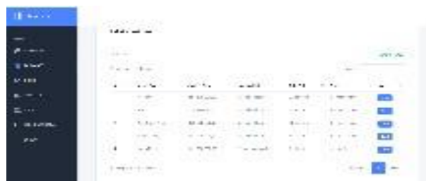
Gambar 7. Halaman paket admin.

Pada halaman ini admin / owner dapat menambah, dan merubah, atau menghapus paket jasa yang ditawarkan pada halaman website (Lihat Gambar 7 ).