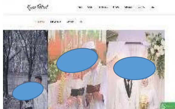
Gambar 2. Halaman portofolio.

Pada tampilan ini calon klien (pengguna) dapat mendeskripsikan dan melihat beberapa contoh hasil foto dari proyek yang pernah dilakukan UMKM kuro potret (Lihat Gambar 2 ).