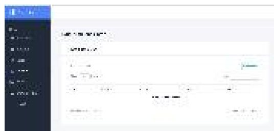
Gambar 9. Halaman contact admin

Pada halaman ini admin dapat melihat kritik dan saran yang masuk dari pelanggan. (Lihat Gambar 9 )