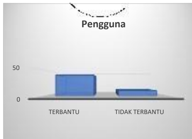
Gambar 13. Diagram pengguna yang merasa terbantu.

Namun dari sisi konsumen sebanyak 50 pengguna aplikasi, 80% pengguna aplikasi pemasaran merasa terbantu untuk mengenal UKM Potret Kuro secara lebih dekat, sedangkan 20% pengguna aplikasi mengatakan bahwa tampilan masih perlu ditingkatkan (Lihat Gambar 13 ).