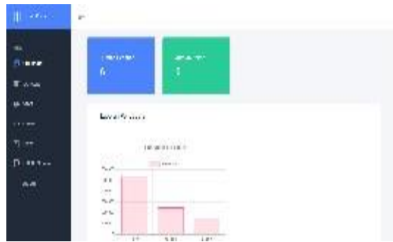
Gambar 6. Dashboard halaman admin.