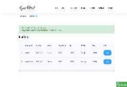
Gambar 4. Halaman checkout.

Pada tampilan ini mengurai detail order yang dilakukan oleh klien dan sebagai dasar project terhadap klien dengan menentukan waktu pelaksanaan dan lokasi yang telah ditentukan oleh klien serta paket yang dipesan oleh pengguna serta penyertaan bukti transfer bagi klien yang telah melakukan pembayaran (Lihat Gambar 4 ).