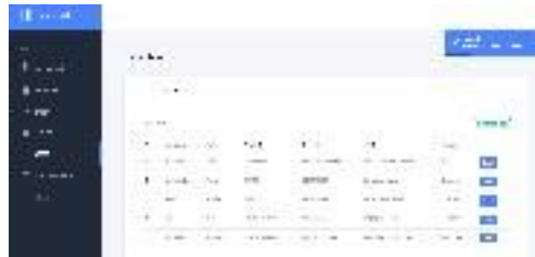
Gambar 10. Halaman users admin

Pada halaman ini admin dapat melihat pengguna yang terdaftar pada website UMKM kuro potret (Lihat Gambar 10 ).