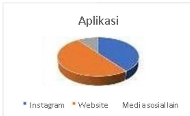
Gambar 12. Diagram kepuasan penggunaan aplikasi.

Namun dari sisi konsumen sebanyak 50 pengguna aplikasi, 80% pengguna aplikasi pemasaran merasa terbantu untuk mengenal UKM Potret Kuro secara lebih dekat, sedangkan 20% pengguna aplikasi mengatakan bahwa tampilan masih perlu ditingkatkan (Lihat Gambar 13 ).