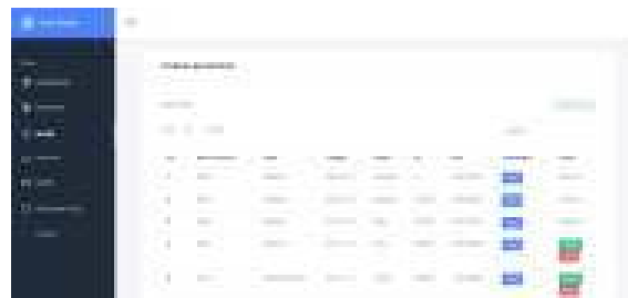
Gambar 8. Halaman order admin

Pada halaman ini admin dapat melihat pesanan yang masuk, selain itu admin juga dapat melihat bukti pembayaran uang muka lalu menerima atau menolak pesanan yang masuk (Lihat Gambar 8 ).