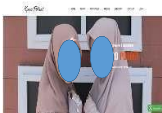
Gambar 1. Halaman home website.

Tampilan ini merupakan halaman awal kuro potret yang menjelaskan kegiatan yang dilakukan oleh UMKMdengan uraian spot background foto, list harga serta event lain yang dapat menjadi bagian pada Kuro potret (Lihat Gambar 1 ).