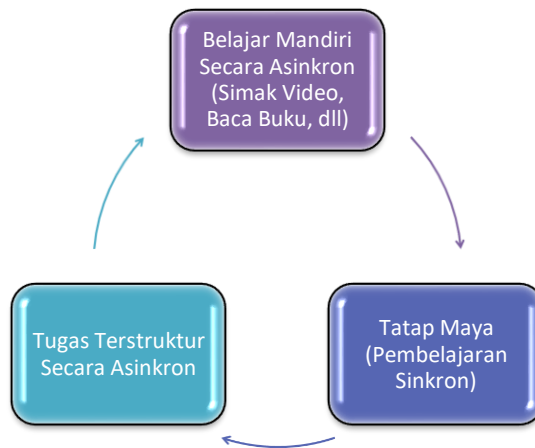
Gambar 1 Proses Pembelajaran Flipped Learning

Penelitian survei ini dilaksanakan setelah dilakukan perkuliahan flipped classroom pada mata kuliah statistika dasar. Tahapan flipped classroom yang telah dilaksanakan dilakukan dalam tiga tahapan sebagaimana tercantum pada gambar 1.