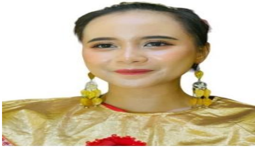
Gambar 1. Rias Tari Randau (Doc. April, 2024)

Dalam busana Tari Randau , penari menggunakan Baju Kurong Melayu dan celana panjang yang terbuat dari bahan satin, serta dilengkapi dengan rok dibawah lutut yang terbuat dari perpaduan bahan songket dan satin sebagai penambah estetika dalam busana Tari Randau . Untuk pemilihan warna busana yang digunakan dalam Tari Randau menggunakan warna yang cerah seperti merah, kuning dan hijau. Warna merah menggambarkan keberanian dan semangat, warna kuning menggambarkan keceriaan, kebahagiaan, dan kelimpahan. Warna hijau dikaitkan dengan kesuburan, pertumbuhan, dan harapan. Aksesoris yang digunakan, seperti bunga mawar dan hiasan kepala, dipilih untuk memberikan sentuhan keindahan serta menyoroti kecantikan alami para penari yang mempersembahkan pertunjukan.