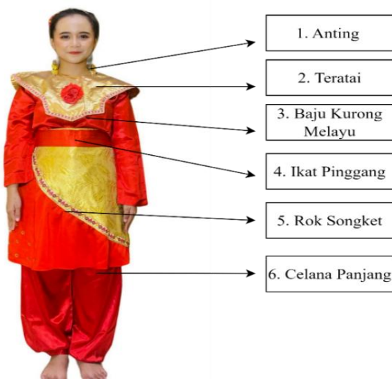
Gambar 2. Busana Tari Randau (Doc. April, 2024)

Dalam busana Tari Randau , penari menggunakan Baju Kurong Melayu dan celana panjang yang terbuat dari bahan satin, serta dilengkapi dengan rok dibawah lutut yang terbuat dari perpaduan bahan songket dan satin sebagai penambah estetika dalam busana Tari Randau . Untuk pemilihan warna busana yang digunakan dalam Tari Randau menggunakan warna yang cerah seperti merah, kuning dan hijau. Warna merah menggambarkan keberanian dan semangat, warna kuning menggambarkan keceriaan, kebahagiaan, dan kelimpahan. Warna hijau dikaitkan dengan kesuburan, pertumbuhan, dan harapan. Aksesoris yang digunakan, seperti bunga mawar dan hiasan kepala, dipilih untuk memberikan sentuhan keindahan serta menyoroti kecantikan alami para penari yang mempersembahkan pertunjukan.