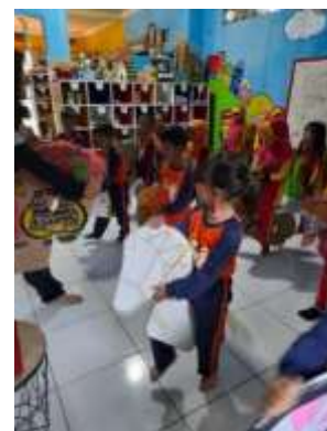
Gambar 4.9 Proses Tari Jaranan Diiringi Dengan Musik (Dokumentasi. Filga, 2022)

Proses pembelajaran yang dilaksanakan pada pertemuan ke dua dan ke tiga sudah selesai dengan gerakan yang telah selesai, pada pertemuan ke empat ini penggunaan property yang dibuat bersama sama dari bahan-bahan bekas. Pada pertemuan ini gerakan dari awal sampai dengan akhir menggunakan gerak yang tepat dan benar menggunakan property hasil karya peserta didik.