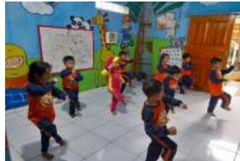
Gambar 4.3 Proses Penyusunan Gerak Tari Jaranan

arahan tambahan gerak tari Jaranan agar lebih mudah dihafal dalam gerakanya, mudah diingat dan menyenangkan sehingga tidak monoton, peneliti mengarahkan beberapan gerakan menggunakan teknik agar peserta didik dapat melaksanakan gerak dengan maksimal