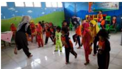
Gambar 4.2 Kegiatan Guru Dan Anak Sedang Melakukan Eksplorasi Gerak Binatang Kuda Berjalan

Pelaksanaan pertemuan ke- 2 ini masih dilaksanakan di dalam kelas. Dimulai dengan pemanasan-pemanasan ringan dilanjut dengan intruksi materi pembelajaran yang akan dilakukan. Peneliti mendemonstrasikan beberapa contoh gerakan hewan kuda berjalan dan berlari yang nantinya akan disusun, durasi waktu tari Jaranan ini 5 menit , untuk target dari pertemuan ke-2 ini 1 menit dengan susunan awal tari Jaranan.