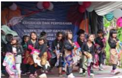
Gambar 4.5 Proses Penerapan Tari Jaranan/Posttest

Akhir pertemuan ini peserta didik menarian tari jaranan diselaraskan dengan iringan musik dan ketukan serta property yang digunakan sehingga dapat ditampilkan menyelurus dari awal hingga akhir, peserta didik sangat antusias dan berlatih dengan sungguh-sunggu, karena oleh ibu kepala sekolah tarian ini akan dijadikan tarian materi belajar berkelanjutan untuk tahun -tahun berikutnya dan tarian ini ditampilkan di acara pentas seni siswa.