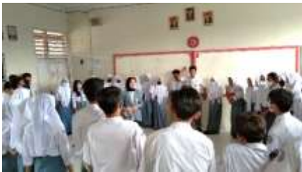
Gambar 3. Penerapan Model Snowball Throwing

Penerapan model snowball throwing . Target dan tujuan pembelajaran untuk memahami ragam gerak tari kreasi dengan unsur gerak tari kreasi. Metode yang digunakan metode diskusi kelompok, peserta didik membuat lingkaran besar, ketua atau perwakilan kelompok maju untuk mengambil 1 bola yang berisi pertanyaan, setiap kelompok diberi waktu untuk mendiskusikan jawaban dari pertanyaan tersebut setiap kelompok maju menjawab dan mempraktekan berdasarkan soal yang mereka dapat, kelompok lain mengapresiasi. Pengukuran evaluasi diukur berdasarkan indikator memberi bentuk.