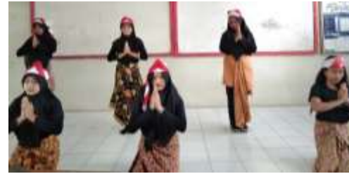
Gambar 4. Siswa Melakukan Posttest

Pertemuan ini digunakan untuk melakukan posttest . Tujuan dan terget pembelajaran mendemonstrasikan perolehan ragam gerak tari kreasi mulai dari gerak kepala, badan, tangan dan kaki. Metode yang digunakan metode tugas proyek, setiap kelompok ditugaskan untuk membuat sebuah karya tari hasil eksplorasi dengan penggunaan unsur tari dan iringan, setiap kelompok memaparkan tema gerak yang digunakan, penampilan karya tari hasil eksplorasi berdasarkan konsep, teknik dan prosedur. Pengukuran evaluasi diukur berdasarkan indikator mewujudkan.