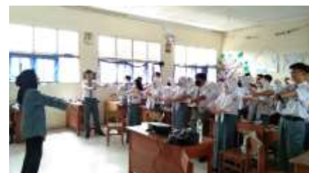
Gambar 2. Materi Eksplorasi Berdasarkan Konsep, Teknik dan Prosedur

Penyampaian materi mengenai eksplorasi gerak tari berdasarkan konsep, teknik dan prosedur dengan penggabungan unsur tari menggunakan media pembelajaran ( power point dan video pembelajaran). Target dan tujuan pembelajaran untuk mengolah informasi mengenai ragam gerak tari kreasi dengan sumber gerak kepala, badan, tangan dan kaki. Metode yang digunakan merupakan metode diskusi dan demonstrasi, peneliti menyampaikan materi mengenai eksplorasi gerak tari, peneliti bersama peserta didik mendemonstrasikan bentuk-bentuk gerak hasil eksplorasi, setelah peneliti memaparkan materi eksplorasi berdasarkan konsep, teknik dan prosedur peserta didik diberi waktu untuk berdiskusi dengan kelompoknya, peserta didik diberi waktu untuk menganalisis dan mengumpulkan informasi sebanyak mungkin. Pengukuran evaluasi diukur berdasarkan indikator merasakan.