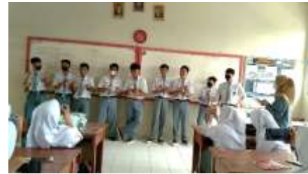
Gambar 1. Siswa Melakukan Pretest

sesuai dengan ide gerak. Pengukuran evaluasi diukur berdasarkan indikator menghayalkan.