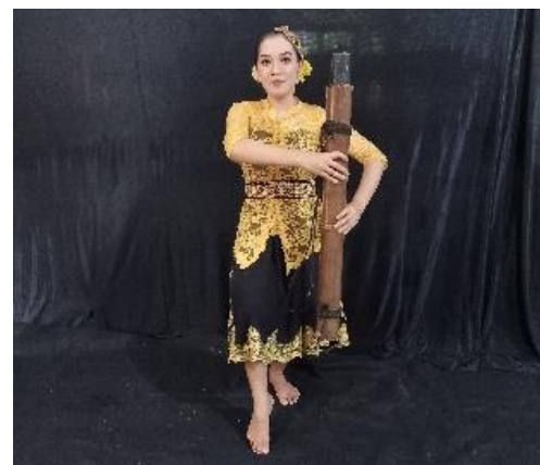
Gambar 8. Ajeg Teteg

Gerakan ini mengandung makna mengajak atau memanggil rekan-rekan untuk ikut mencari air. Artinya bagi kehidupan semua makhluk hidup air adalah sumber penting bagi kehidupan. Gerakan ini menyimbolkan ajakan. Deskripsi gerak Posisi kedua kaki dibuka lebar, tangan kiri memegang bambu dan tangan kanan memegang kayu kecil sebagai panakol untuk dibunyikan dengan bambu.