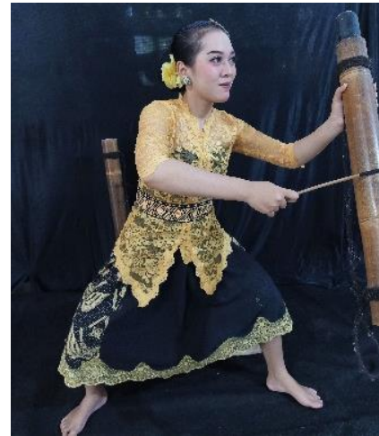
Gambar 7. Tongtrok Awi

lurus menunjuk, dan tangan kiri dilipat menekuk ke dalam.