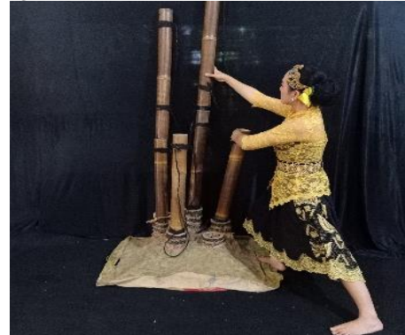
Gambar 11. Milih Awi

bambu sebagai alat dalam proses ngabalukbuk. Deskripsi gerak Kedua tangan memegang bambu mengayun pelan kearah atas dengan posisi kaki kanan di tekuk ke depan dan kaki kiri lurus ke belakang.