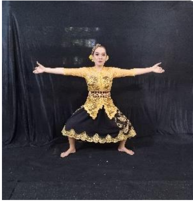
Gambar 1. Namprak

Gerakan ini mengandung makna dalam menggambarkan tentang kebersamaan dan saling merangkul, artinya setiap manusia harus mampu membuka diri untuk dapat bekerjasama dengan manusia lainnya. Gerak ini menyimbolkan keterbukaan. Deskripsi gerak kedua tangan terbuka lebar dengan kaki kuda-kuda dan tumpuan badan di tengah.