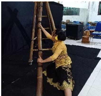
Gambar 14. Nyambung Awi

Gerakan ini mengandung makna mencari dan mengajak masyarakat sebelum menyambungkan saluran air secara bersama-sama. Artinya setiap media mampu menghasilkan air yang melimpah jika medianya di pilih dan di gabungan dengan benar. Gerakan ini menyimbolkan ajakan. Deskripsi gerak Posisi kaki adeg-adeg kembar bentuk V, dengan tangan kiri memegang bambu yang disangkut ke bahu kiri, dan tangan kanan nyawang