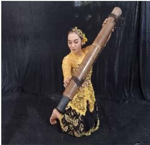
Gambar 9. Awi Ngucur

depan, dengan kedua tangan memegang bambu di sebelah kiri.