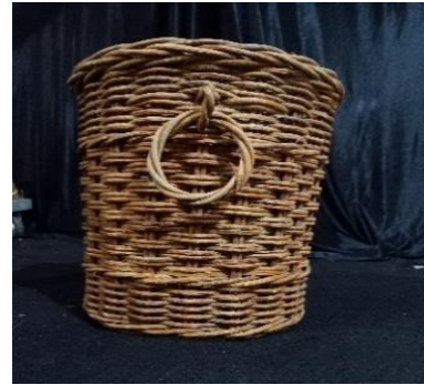
Gambar 3.9 Keranjang

Simbol Properti ini merupakan sumber mata air yang kelak akan mengalir setiap rumah. Dengan