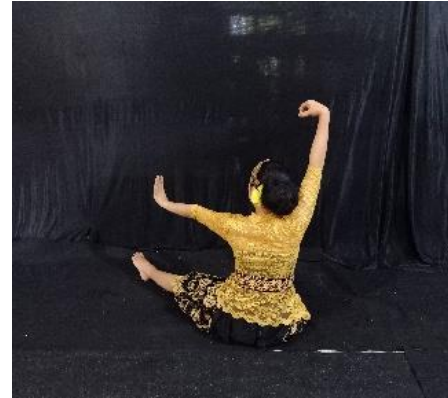
Gambar 3. Lonjo Nyampurit

Makna gerak ini menggambarkan tentang ketundukan kita terhadap Sang Pencipta/Tuhan YME. Artinya setiap makhluk hidup memiliki rasa cinta dan patuh terhadap Tuhan YME. Gambar gerakan ini menyimbolkan kepatuhan. Deskripsi gerak Posisi kaki dekuh duduk level bawah, dengan kedua tangan disimpan dibagian paha mengepal.