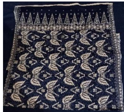
Gambar 3.10 Sinjang

Properti ini memiliki simbol tempat untuk menaruh cucian setelah di cuci.