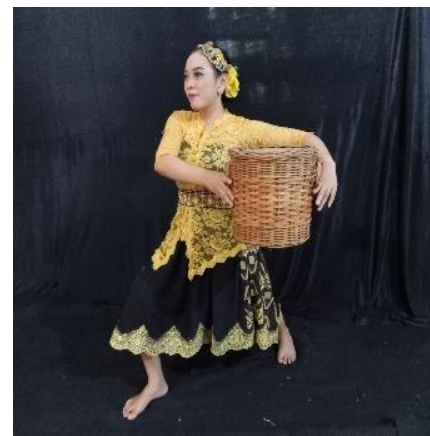
Gambar 12. Ngelek Bakul

Makna menggambarkan kegiatan memilah bambu yang akan digunakan untuk menjadi saluran air. Artinya pemilihan yang terbaik media air ialah hal penting yang harus di pertimbangkan. Gambar gerakan ini menyimbolkan aktivitas memilah bilahan bambu. Deskripsi gerak Posisi kaki kanan ditekuk dan condong ke depan dengan tangan memegang memilih bambu.