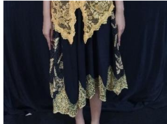
Gambar 1. Rok

makna penggambaran pakaian yang digunakan oleh sosok perempuan pedesaan saat beraktivitas. Simbol Busana tari ini bernuansa batik baduy khas banten dengan warna hitam dan kuning emas.