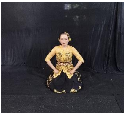
Gambar 2. Calik Deku

Gerakan ini mengandung makna dalam menggambarkan tentang kebersamaan dan saling merangkul, artinya setiap manusia harus mampu membuka diri untuk dapat bekerjasama dengan manusia lainnya. Gerak ini menyimbolkan keterbukaan. Deskripsi gerak kedua tangan terbuka lebar dengan kaki kuda-kuda dan tumpuan badan di tengah.