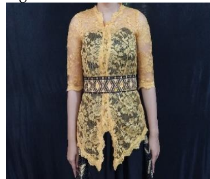
Gambar 2. Kebaya

makna penggambaran pakaian yang digunakan oleh sosok perempuan pedesaan saat beraktivitas. Simbol Busana tari ini bernuansa batik baduy khas banten dengan warna hitam dan kuning emas.