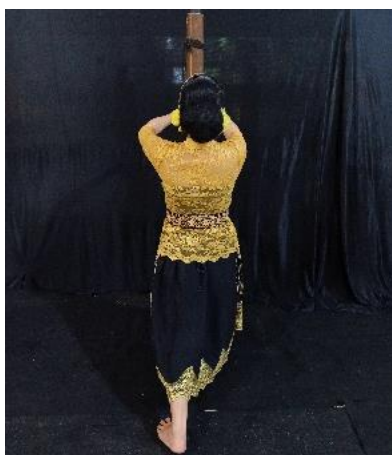
Gambar 10. Ayun Awi

Gerakan ini mengandung makna Gerakan ini menggambarkan sedang menumpahkan air dari bambu. Artinya bambu ini menjadi media air dalam kehidupan semua makhluk hidup bahwasanya air adalah sumber kehidupan. Gerak ini meyimbolkan sebuah aktivitas dalam proses ngabalukbuk. Deskripsi gerak posisi badan level bawah duduk dekuk dengan kedua tangan memegang bambu dalam keadaan bambu dimiringkan