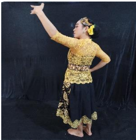
Gambar 6. Sawang Ajeg

Gerakan ini mengandung makna dalam menggambarkan bentuk saling menghargai dengan anggota masyarakat lain. Artinya setiap manusia membutuhkan manusia lainnya oleh karena itu menghargai setaip keputusan dan mampu bersosialisasi dengan masyarakat lainnya. Gerakan ini menyimbolkan saling menghormati dan menghargai. Deskripsi gerak Posisi badan bungkuk dengan kedua tangan disamping dan kaki yang menutup.