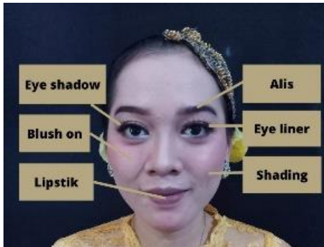
Gambar 1. Rias Tari Ngabalukbuk

Rias yang digunakan dalam Tari Ngabalukbuk ini adalah rias cantik yang menonjolkan perempuan pedesaan yang mempunyai sifat yang anggun dan tegas dalam berperilaku.