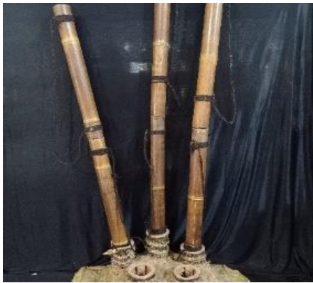
Gambar 1. Ruas Tiga Bambu