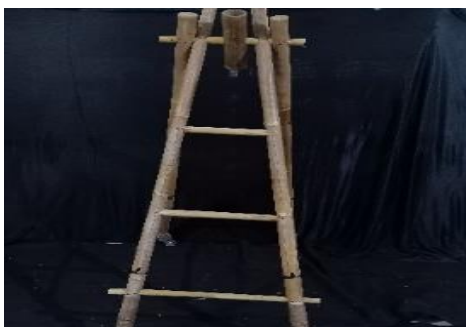
Gambar 2. Roda Awi

Simbol Bambu untuk mengalir air setiap rumah dari mata air yang di temukan.