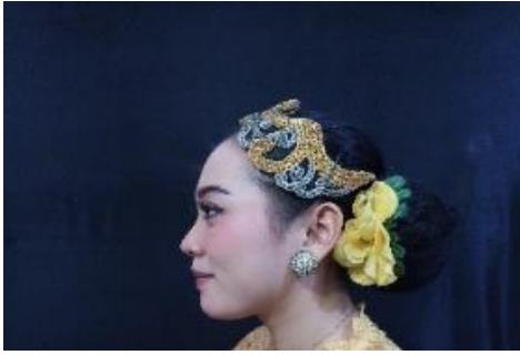
Gambar 3. Aksesoris