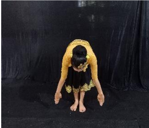
Gambar 5. Bongkok Nungkul

Gerakan ini mengandung makna dalam menggambarkan bentuk saling menghargai dengan anggota masyarakat lain. Artinya setiap manusia membutuhkan manusia lainnya oleh karena itu menghargai setaip keputusan dan mampu bersosialisasi dengan masyarakat lainnya. Gerakan ini menyimbolkan saling menghormati dan menghargai. Deskripsi gerak Posisi badan bungkuk dengan kedua tangan disamping dan kaki yang menutup.