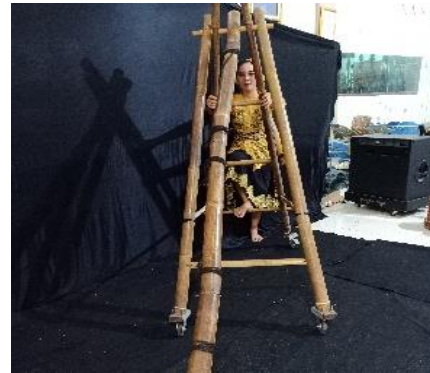
Gambar 15. Terekel

dilipat ke dalam, kaki kiri memanjang ke depan, dengan posisi tangan memegang menyambungkan bambu.