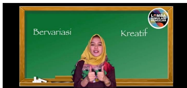
Gambar 3. Kegiatan Penutup pada video pembelajaran pertama

Guru menjelaskan secara rinci namun tidak sendiri melainkan berkomunikasi dengan siswa. Selain itu, guru menerangkan tujuan dari gambar yang ditampilkan agar anak-anak dapat memahami makna dari gambar tersebut setelah itu guru meminta siswa untuk bereksplorasi mengenai gerak tari sesuai stimulus yang diberikan yang dapat meningkatkan kreatifitas siswa. Dalam pembelajaran yang dilakukan guru menampilkan contoh siswa dalam bereksplorasi gerak, hal ini akan mempermudah siswa untuk mencoba bereksplorasi, tidak lupa guru memberikan motivasi terhadap siswa untuk meningkatkan semangat siswa dalam belajar. Selanjutnya, pada tahap penyusunan gerak guru mencoba memberikan arahan kepada siswa untuk menyusun gerak dimana siswa menggabungkan gerak pertama dan kedua lalu setelah penyusunan gerak sudah dilaksanakan guru meminta perwakilan siswa untuk memperlihatkan hasil eksplorasi, dalam video pembelajaran ini guru memperlihatkan contoh siswa dalam menampilkan gerak tari yang telah dieksplorasi, dan tidak lupa guru memberikan apresiasi terhadap siswa yang telah menampilkan hasil karyanya, ketika gerak telah disusun guru menambahkan materi dengan menambahkan iringan musik pada gerak tari, pada proses pembelajaran ini berlangsung guru menampilkan gerak tari yang telah disusun sudah menggunakan iringan musik papua.