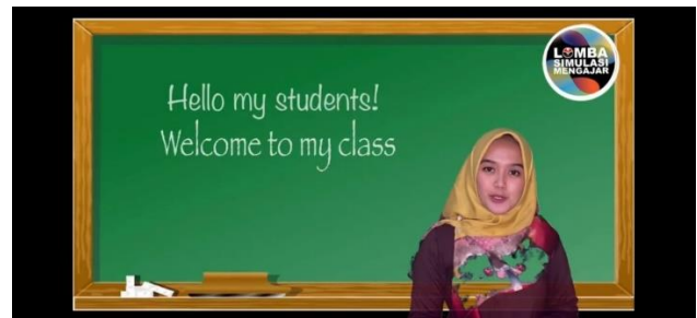
Gambar 1. Kegiatan Pembuka dalam video pembelajaran pertama

Proses pembelajaran pada video pembelajaran tentunya sama dengan proses pembelajaran seperti biasa dimana ada kegiatan pendahuluan, kegiatan ini dimulai dengan guru melakukan perkenalan dan menjelaskan materi yang akan dipelajari yaitu gerak tari papua berdasarkan ruang, selanjutnya kepada proses pembelajaran dimana guru melakukan kegiatan pendahuluan terlebih dahulu.