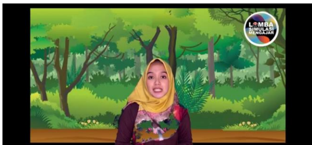
Gambar 2. Kegiatan inti dalam video pembelajaran pertama

video pembelajaran ini memperagakan dan menjawab pertanyaan guru, dengan adanya siswa disini dapat membuat pembelajaran berjalan dengan baik dikarenakan siswa disini menjadi contoh siswa yang kreatif dan berpikir luas dan tidak lupa pada proses pembelajaran ini guru melakukan apresiasi terhadap siswa.