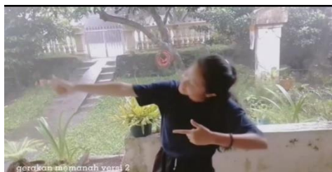
Gambar 6. Hasil pembelajaran pada video pembelajaran pertama

Hasil pembelajaran pertama terlihat pada hasil dari pembuatan video yang dibuat siswa, guru dapat melihat seberapa paham siswa dalam pembelajaran daring melalui video pembelajaran dari youtube .