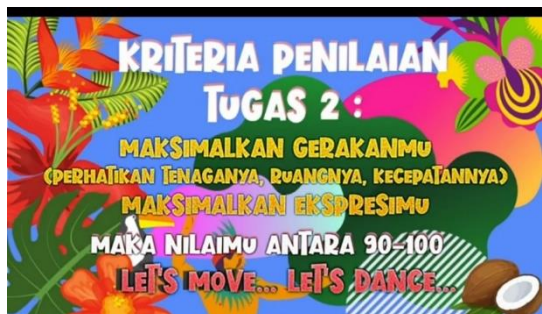
Gambar 6. Kegiatan Penutup pada video pembelajaran kedua

Kegiatan penutup pada tahap ini guru melakukan apresiasi terhadap semangat siswa dalam pembelajaran dan tidak lupa selalu memotivasi untuk terus meningkatkan semangat belajar walaupun dalam keadaan pandemik ini.