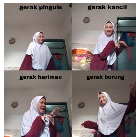
Gambar 2. Hasil Eksplorasi Siswa FY