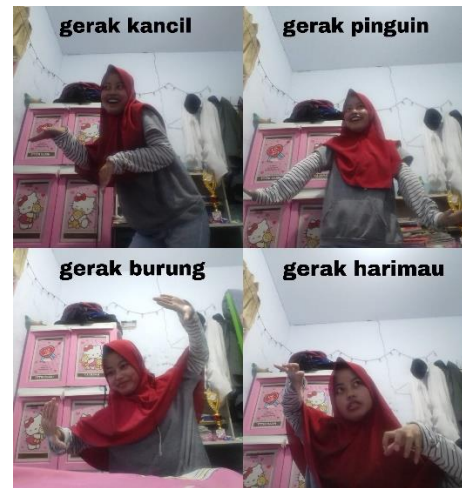
Gambar 1. Hasil Eksplorasi Siswa SH (Dok. Nofa, 2021)

Proses treatment kedua ini materi yang disampaikan yaitu tentang gerak tari berdasarkan raung, tenaga dan level dengan stimulus gambar yang diberikan kepada siswa tuna rungu. Tahap ini sama halnya dengan tahap pertama pada pembelajaran yang dilakukan dengan memberikan stimulus visual untuk mengeksplorasi gambar tersebut. Gambar yang diberikan berupa gambar hewan kancil, harimau, burung dan pinguin, siswa diharapkan mampu bereksplorasi meniru gerak hewan tersebut ketika berlari, berjalan, mencekam dan terbang kemudian hasil eksplorasi berupa foto siswa sedang bergerak sesuai perintah kemudian dikirimkan melalui whatsapp . Peneliti memberikan penjelasan terkait gerak berdasarkan unsur tari dimana unsur tari mencakup unsur ruang (luas, sedang dan sempit), unsur tenaga yang dapat diekspresikan melalui ekspresi wajah dengan tenaga kuat, sedang dan lemah serta unsur level dalam tari yaitu tinggi atau rendahnya gerak ketika menari. Gerak yang sudah dibuat kemudian dihubungkan dengan bunyi alat musik sesuai ketukan yang bervariasi terlihat selaras dan indah, hal ini memudahkan peneliti untuk menilai kemampuan gerak siswa tuna rungu.