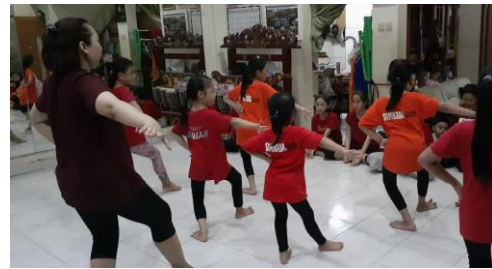
Gambar 1. Proses Pembelajaran Tari Jaipong Pada Anak Usia 7-9 Tahun

evaluasi besar belum bisa dilaksanakan. Aspek penilaian dari setiap evaluasi yaitu penguasaan terhadap Wiraga, Wirahma, dan Wirasa .