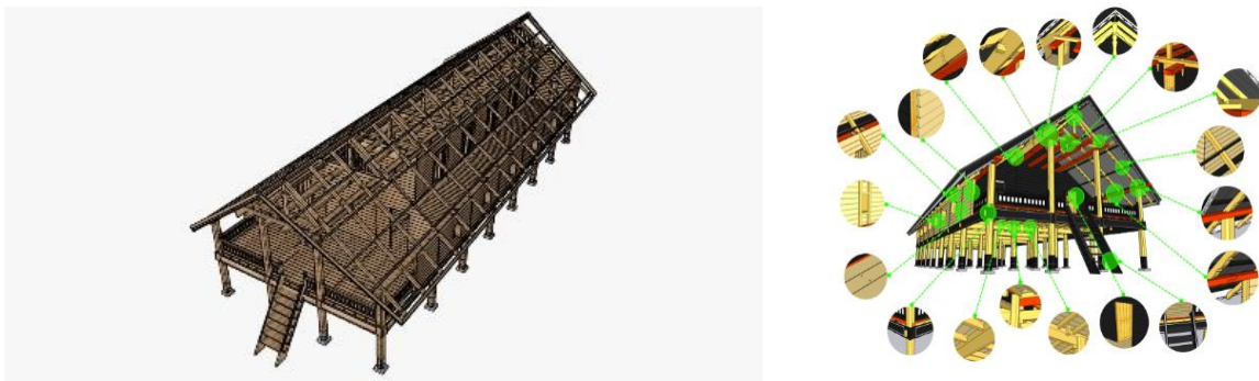
Gambar 3. Objek Posisi Joint untuk Workshop Ketukangan UPR

Pendekatan pelatihan secara praktis melakukan praktek kerja dengan objek UPR skala 1:1, khususnya pada sistem konstruksi bangunan UPR terkait aspek joint di beberapa tempat penting. Lihat Gambar 3.