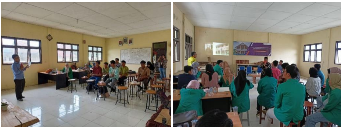
Gambar 4. Kegiatan pemaparan materi secara tatap muka di SMK 5