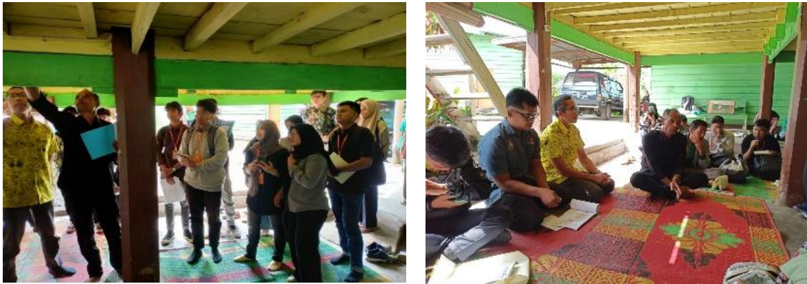
Gambar 5. Kegiatan Pengamatan UPR di Desa Pegasing

Peserta mendapat penjelasan langsung terkait filosofi sistem sambungan, karakter material bangunan UPR masa lalu dan masa kini yang mengalami penyesuaian. Hal ini terkait dengan ketersediaan material alam yang mulai langka.