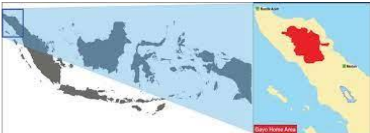
Gambar 1. Lokasi Sebaran Masyarakat Gayo dan Arsitektur Umah Pitu Ruang (UPR)

Umah Pitu Ruang (UPR) merupakan salah satu peninggalan karya arsitektur vernakuler masyarakat gayo, yang keberadaannya saat ini sudah sulit untuk ditemukan. UPR sebagai tempat tinggal Reje (kepala desa) dan keluarganya, yang juga berfungsi sebagai tempat warga berkumpul, bermusyawarah, dan melakukan kegiatan berkesenian. Oleh karena itu UPR merupakan bangunan panggung besar yang memiliki banyak tiang dan terdapat banyak kamar dan 3 serambi yang memiliki fungsi berbeda-beda. Secara tipologi, UPR tampak merespon kondisi lingkungan pergunungan yang dingin dan kondisi lingkungan alam yang relative tidak ramah. Lihat kondisi geografis sebaran masyarakat Gayo dan Arsitektur UPR seperti pada gambar 1.