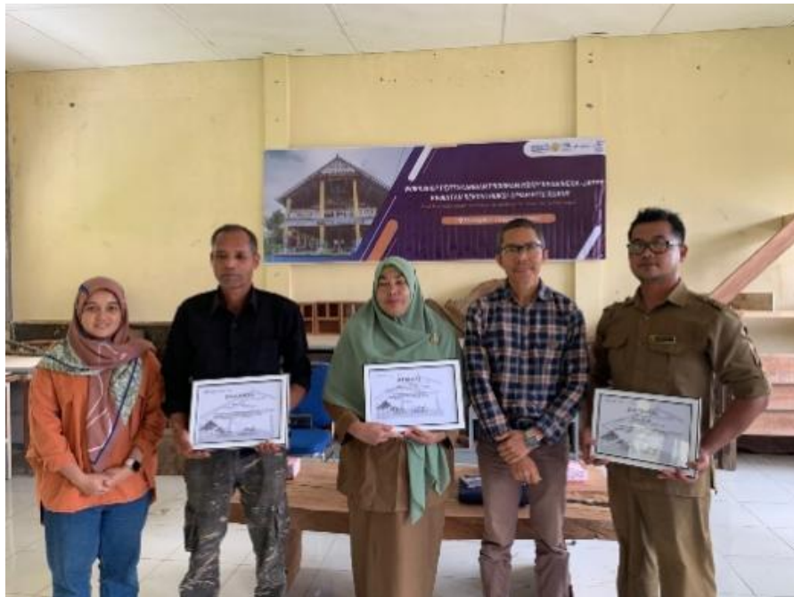
Gambar 6. Pemberian Sertifikat bagi Pengajar, Tokoh Adat, dan Peserta Kegiatan

Berdasarkan hasil pengamatan, peserta pelatihan dinilai sudah dapat mencapai target luaran yang diharapkan, dengan berpartisipasi aktif di dalam keseluruhan rangkaian kegiatan, menunjukkan ketertarikan di setiap pembahasan dan bersedia ikut terlibat di dalam kegiatan pelestarian arsitektur tradisional Umah Pitu Ruang di waktu yang akan datang. Kegiatan di tutup dengan pemberian sertifikat bagi pengajar, tokoh adat dan peserta pada gambar 7.