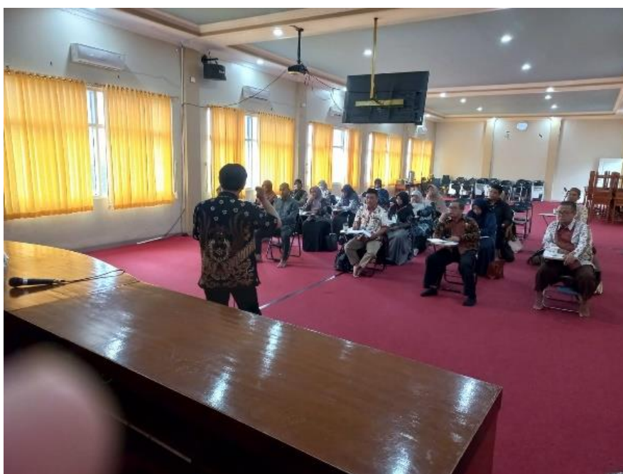
Gambar 1. Pengenalan Teori Penelitian Tindakan Kelas

Langkah rinci yang umumnya dilakukan oleh guru mulai dari membuat perencanaan, melakukan tindakan, observasi dan refleksi aadalah sebagai berikut: (1) Memantapkan tujuan dan memilih topik. (2) Identifikasi permasalahan kelas dan mengumpulkan data awal. (3) Menganalisis faktor penyebab permasalahan. (4) Mempelajari teori pendukung dan/atau penelitian yang relevan. (5) Merumuskan permasalahan penelitian. (6) Menetapkan hipotesis tindakan,yakni hal yang di harapkan terjadi jika suatu tindakan di lakukan. (7) Mengembangkan rencana tindakan penelitian (8) Melaksanakan tindakan perbaikan (9) Mengumpulkan dan menganalisis data. (10) Melakukan refleksi. (11) Membuat revisi perencanaan berdasarkan refleksi (12) Melaksanakan tindakan berdasarkan rencana uyang telah di revisi.