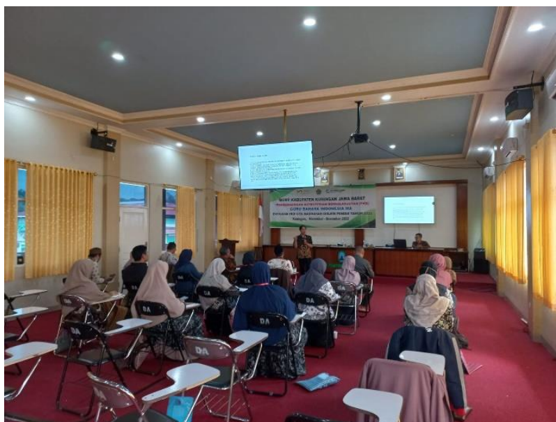
Gambar 3. Latihan Penelitian Tindakan Kelas

Dalam proses ini pengabdian pada masyarakat melakukan beberapa tahapan dalam proses latihan kepada para guru yang hadir untuk (1) memilih materi pembelajaran yang mereka ingin lakukan analisis (2) memilih sub materi pembelajaran di kelas (3) menentukan kelas yang digunakan untuk penelitian PTK (4) memilih metode pembelajaran yang relevan (4) membuat alur proses langkah pembelajaran (5) membuat alur proses langkah penelitian. Dari 6 proses tersebut adalah gambaran umum praktik penulisan penelitian Tindakan kelas yang dapat diimplementasikan langsung kepada siswa mereka di sekolah.