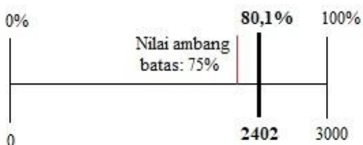
Gambar 1. Garis ukuran tingkat pengetahuan responden secara umum mengenai wisata trekking