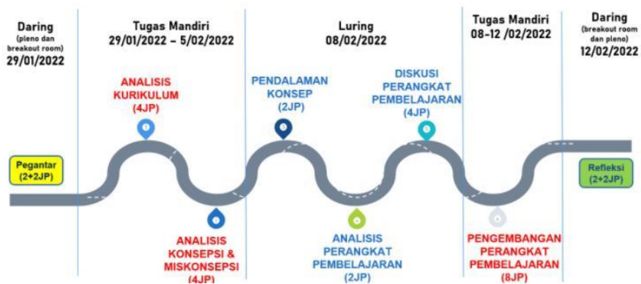
Gambar 1. Alur pelaksanaan kegiatan.