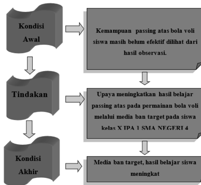
Gambar 1. Kondisi Awal, Tindakan, kondisi Akhir

Alur kerangka pikir dalam penelitian dapat ini secara skematis dapat dilihat pada skema dibawah ini.