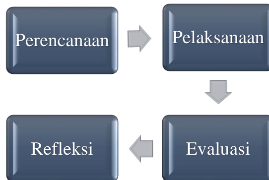
Gambar 2. Model Penelitian dari Kurt Lewin

Adapun populasi dalam penelitian ini adalah seluruh jumlah siswa kelas X IPA 2 yang jumlahnya 37 orang. Sedangkan sampel adalah bagian dari jumlah dan karakteristik yang dimiliki oleh populasi tersebut (Bahrun, S., Alifah, S., & Mulyono, S. 2018). Adapun sampel dalam penelitian ini adalah seluruh siswa kelas X IPA 2 yang berjumlah 37 orang, di mana siswa laki-laki sebanyak 10 orang dan siswa perempuan sebanyak 27 orang. Sampel ini diambil dengan menggunakan total sampling.