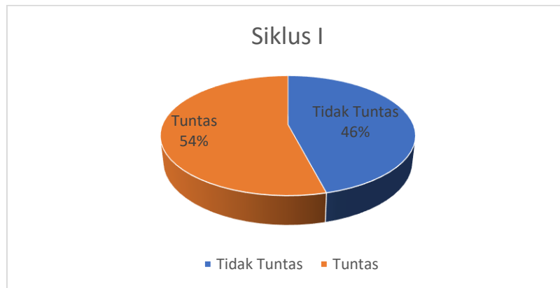
Gambar 4. Deskripsi Hasil Belajar Siklus I Passing Bola Voli

Berdasarkan tabel deskripsi hasil belajar siklus I Passing dalam permainan bola voli dengan menggunakan gaya mengajar Resiprokal di atas dapat dilihat bahwa kemampuan siswa dalam pembelajaran Passing masih tergolong rendah. Dari 37 orang siswa yang menjadi sampel dalam penelitian ini, ternyata hanya 20 orang siswa (54,05%) yang memiliki ketuntasan belajar, sedangkan selebihnya 17 orang siswa (45,95%) belum memiliki ketuntasan belajar. Dengan nilai rata-rata hasil belajar siswa adalah 64,4.