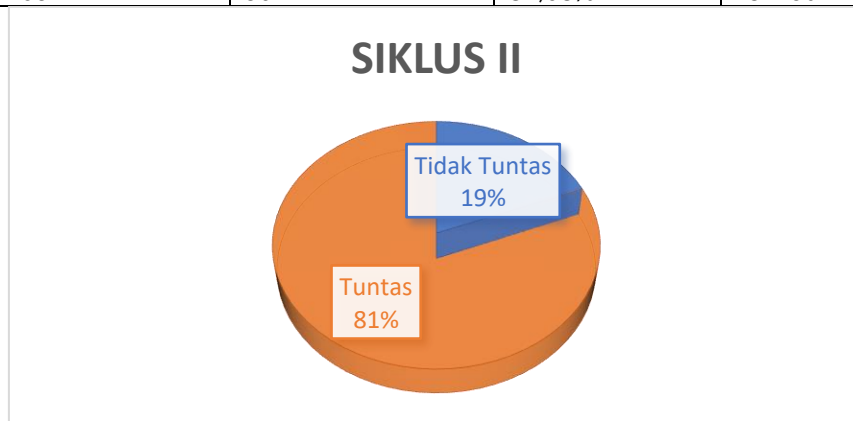
Gambar 5. Deskripsi Hasil Belajar Siklus II Passing Bola Voli Siswa

Dari data hasil siklus II yang didapat terlihat bahwa kemampuan siswa dalam melakukan tes hasil belajar secara klasikal sudah meningkat, walaupun ada sebagian siswa yang hasilnya tetap namun sebagian lagi ada yang meningkat. Dari 37 orang siswa terdapat 30 orang siswa (81,08 %) yang telah mencapai ketuntasan belajar, sedangkan 7 orang siswa (18,91 %) belum mencapai ketuntasan belajar. Dengan nilai rata-rata hasil belajar siswa adalah 78,1 berarti meningkat dari hasil sebelumnya.