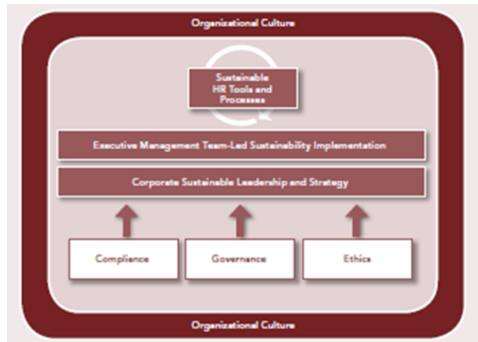
Gambar 3. Penerapan HRM dalam UMKM

Penerapan Human Resources Manajement dalam UMKM yang mengoptimalkan sumber daya internal perusahaan berkaitan erat dengan konsep resources based value (RBV). Konsep RBV diambil dari pendapat Wernefelt, 1984 dan Barney, 1991) bahwa The RBV propose that competitive advantage comes from the internal resources that it poses by an organization . RBV juga menyajikan penjelasan teori bahwa bagaimana perusahaan dapat berkontribusi terhadap kinerja dan keunggulan bersaing. Human Resources resources Based Theory dalam lingkup UMKM dapat dijelaskan sebagai berikut: